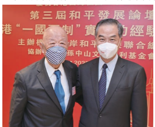
◆梁振英(右)與陳守仁現場合照。