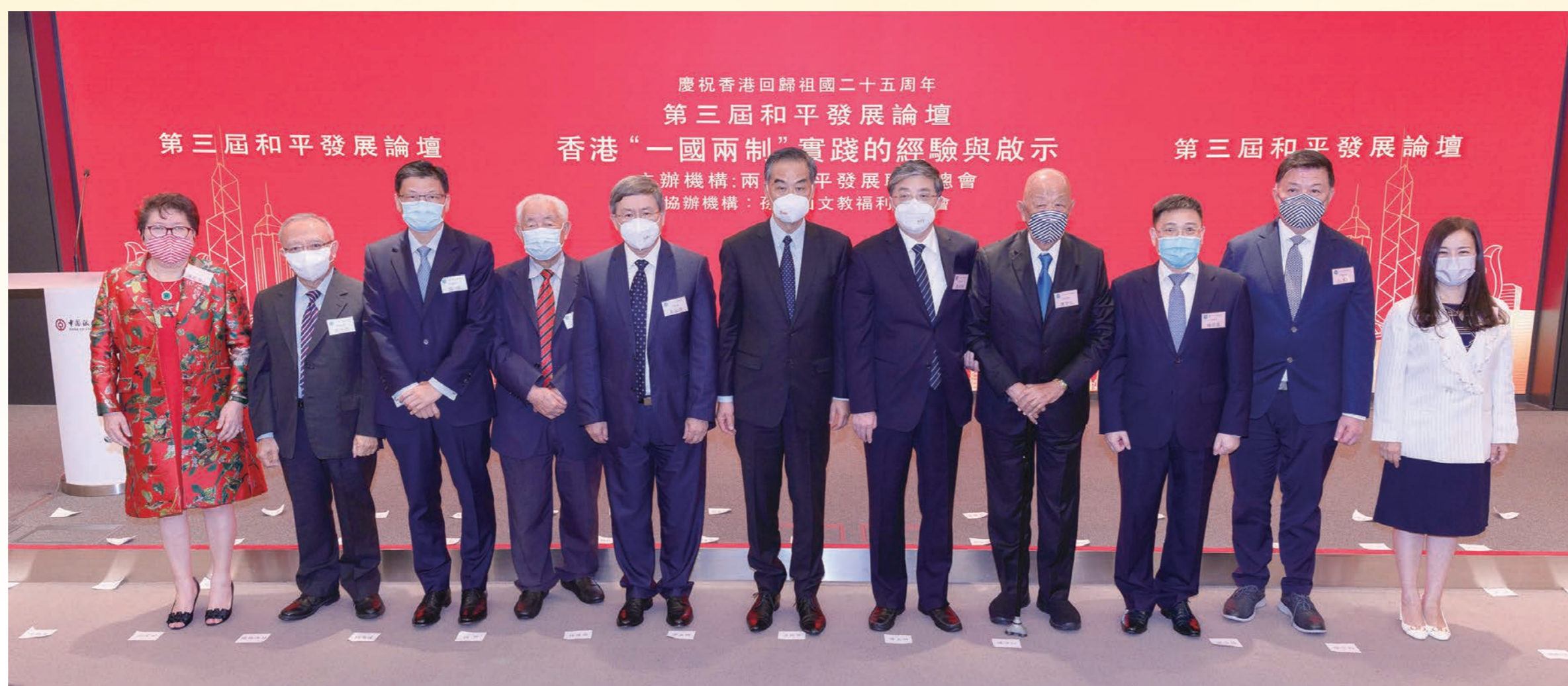
◆以「香港『一國兩制』實踐的經驗與啟示」為主題的第三屆和平發展論壇在香港中銀大廈報告廳舉行。

由兩岸和平發展聯合總會(和發會)主辦、孫中山文教福利基金會協辦的第三屆和平發展論壇「香港『一國兩制』實踐的經驗與啟示」日前(2022年7月21日)於香港中銀大廈報告廳圓滿舉行。今年是香港回歸祖國25周年。25年來,在祖國全力支持下,在特區政府和社會各界共同努力下,「一國兩制」實踐在香港取得舉世公認的成功。為學習貫徹習近平主席「七一」重要講話精神,增進香港各界對「一國兩制」的認知和理解,在新階段推動「一國兩制」實踐行穩致遠,兩岸和平發展聯合總會舉辦是次論壇。