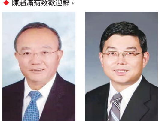
◆劉兆佳發表主題演講。