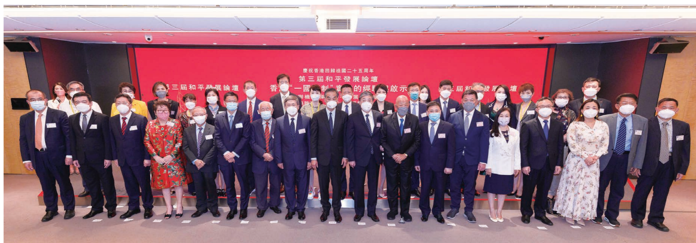
◆主禮嘉賓與和發會會員大會合照。