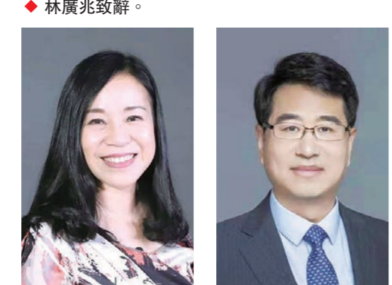
◆王振民發表主題演講。

全國政協副主席梁振英,中央人民政府駐香港特別行政區聯絡辦公室副主任羅永綱,香港特別行政區政府副司長卓永興和兩岸和平發展聯合總會會長陳守仁,中聯辦台灣事務部部長楊流昌,兩岸和平發展聯合總會會長林廣兆,中國銀行(香港)有限公司副董事長兼總裁孫煜,全國港澳研究會副會長劉兆佳,全國政協委員、兩岸和平發展聯合總會台灣研究中心顧問凌友詩,孫中山文教福利基金會理事長陳亨利,兩岸和平發展聯合總會會長陳趙滿菊擔任活動主禮嘉賓。