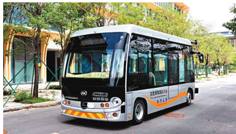
智駕巴士平台所依託的科研項目「協同智能驅動的無人駕駛關鍵技術與平台」，是珠海澳大科技研究院智慧城市研發中心的重點研究方向之一，該中心的科研團隊由澳門大學校長宋永華領銜，通過深度產學研合作融通創新。珠海澳大科技研究院有關負責人表示，「智駕巴士平台」研究項目已獲得了國家重點研發計劃「物聯網與智慧城市」重點專項、澳門科學技術發展基金的人工智能

據了解，此次「橫琴之行」，依據研究團隊對智駕巴士在澳門大學校園的測試情況，結合最新研究成果，對該巴士進行功能性和可靠性方面的升級改造，尤其是在駕駛環境感知認知和規劃決策方面。此次升級改造將傳統的「GPS尋跡模式」轉型升級為「同步定位與地圖構建技術」，利用激光雷達等傳感器，實現自動構建環境地圖。此外，研究團隊還在巴士平台上設計部署了基於5G的車路協同系統，利用「雲-邊-端」智能技術加速自動駕駛車輛快速落地發展。