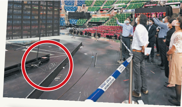
◆事故發生後，小組調查中的照片顯示其中一邊鋼索斷裂。 資料圖片