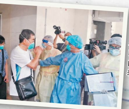
◆阿Mo的父母前日到伊利沙伯醫院探望愛兒後離開時，父親抱拳向守候的傳媒表達謝意。