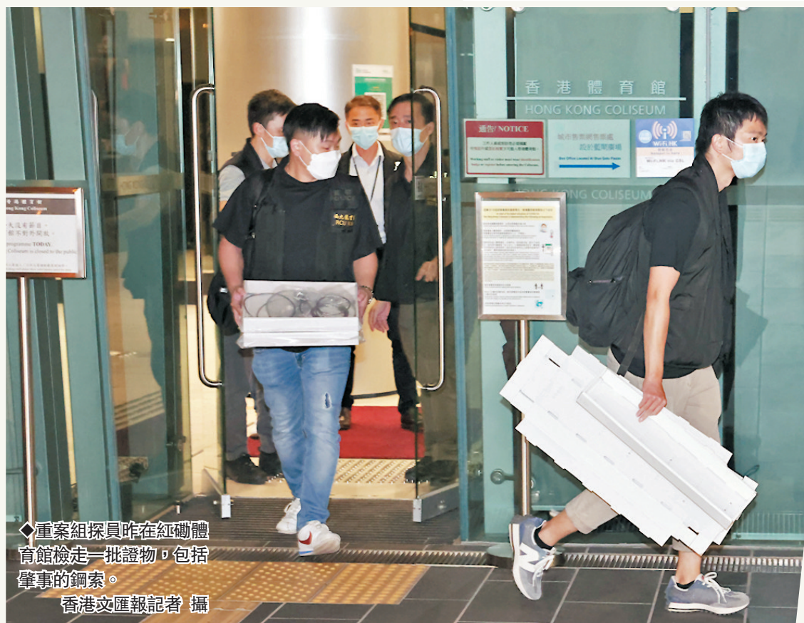
◆重案組探員昨在紅磡體育館檢走一批證物，包括肇事的鋼索。