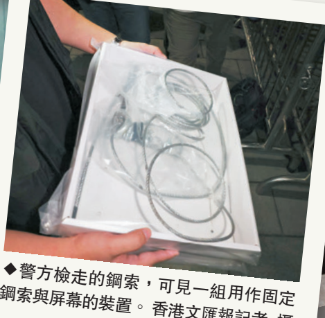
◆警方檢走的鋼索，可見一組用作固定鋼索與屏幕的裝置。