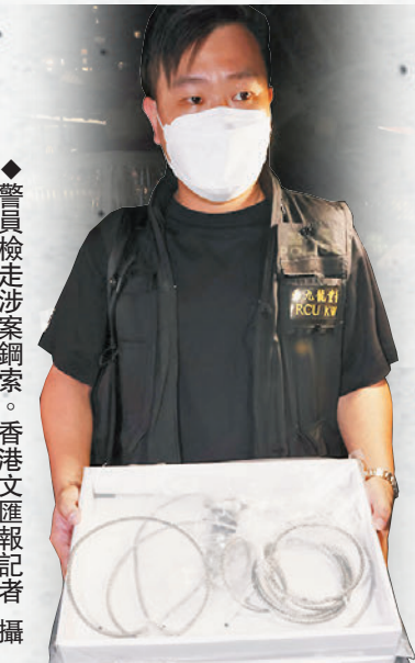
◆警員檢走涉案鋼索。