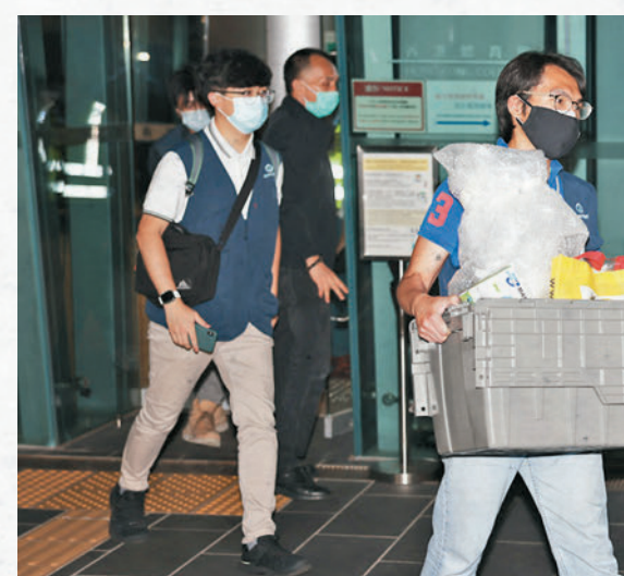
◆重案組探員昨在紅磡體育館檢走一箱證物。

另外，小組公布康文署表演場地由昨日起實施3項短期措施，包括暫停使用懸吊於高空用作擺動或旋轉或乘載人員的機械裝置，其餘舞台裝置亦需每日檢查。香港機場管理局屬下負責管理的亞洲國際博覽館昨日表示，將遵從康文署上述有關措施，會要求場館舉行的活動符合相關要求，例如暫停使用懸吊於高空用作擺動，或旋轉或乘載人員的機械裝置。