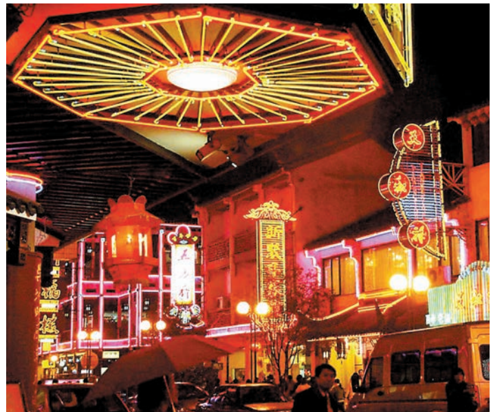
◆ 蘇州太監弄美食老街的夜景。

◆ 林愛妮 語言傳意學部講師 香港專業進修學校 網址：www.hkct.edu.hk/ 聯絡電郵：dlgs@hkct.edu.hk