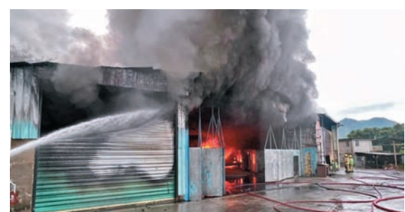
◆三級火警中，消防員開動4喉從不同位置進行灌救。

香港文匯報訊（記者 蕭景源）粉嶺軍地發生致命三級火。一間儲存海鮮及糧油食品的貨倉於昨晨起火並迅速蔓延，250名消防員開動4條喉灌救，同時出動無人機、滅火機械人，撲救逾11小時將火救熄。消防員在貨倉內發現一具焦屍，初步相信死者為貨倉一名男職員。由於死者屍體已嚴重燒焦，真正身份仍有待確定，及等候進一步檢驗確定死因。警方聯同消防處正調查火警原因及是否涉及刑事。