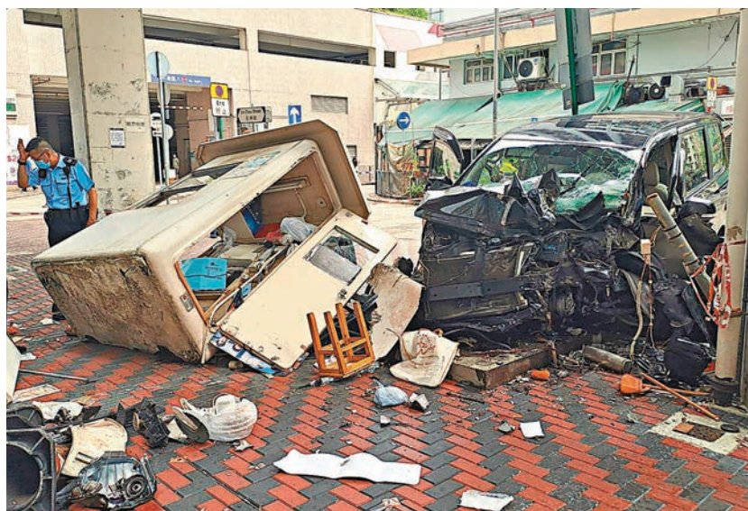
◆車禍後，警員趕至封鎖現場調查意外原因。