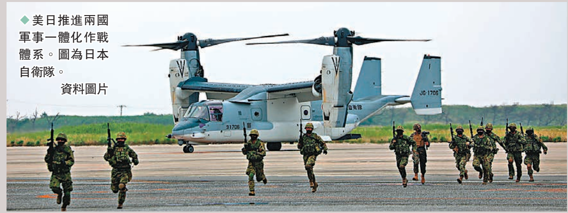
◆美日推進兩國軍事一體化作戰體系。圖為日本自衛隊。資料圖片