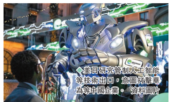
◆美日研究管制人工智能等技術出口，意圖打擊華為等中國企業。資料圖片