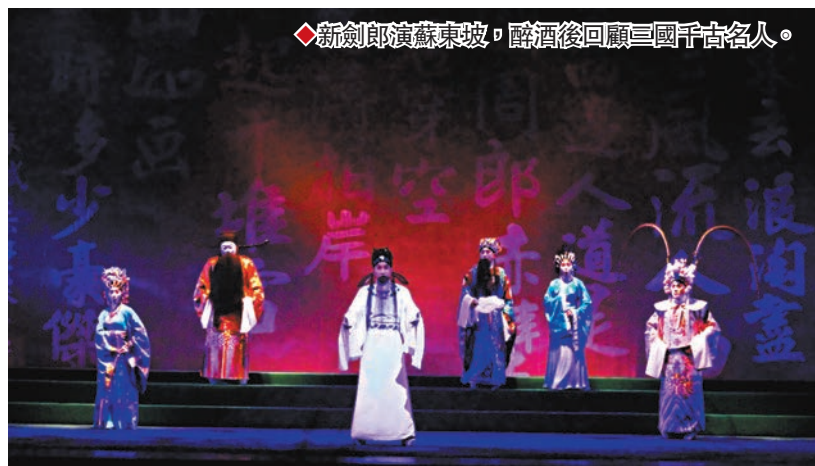
◆新劍即演蘇東坡，醉酒後回顧三國千古名人。