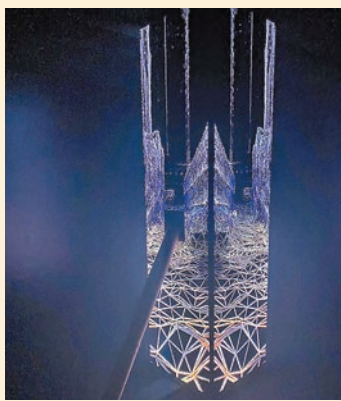
◆Dimension Plus 《NEW CANVAS 04: TOWER LANDSCAPE》