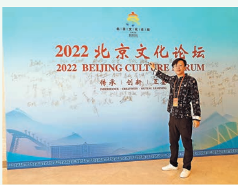
◆作者作為唯一香港代表參與首屆北京文化論壇。

建文化之橋。下午參觀考察的北京地標文化路線共三條，分別是中軸線、首鋼園和大運河，我參觀的是通州大運河路線。通州是北京城市副中心，我沿着路線參觀了三廟一塔，三廟就是儒釋道在一起的廟，一塔指的是在廟裏的燃燈塔。古時候從大運河坐船從南方到北京辦事赴考等，見此塔就等於到了北京，當然現代人可以坐船在大運河上觀光，而通州城市副中心正興建有三大公共文化設施：圖書館、博物館和劇院。新圖書館已經升級，已不是在書架拿書那種傳統的做法，而是智慧書庫，簡單說就是我要借或還什麼書，在屏幕下命令，物流機器人就會在倉庫裏把書取出來給我或存回倉庫內。晚上我們在首鋼園區的三號高爐觀看主題為「山河永定 共向未來」的北京西山永定河文化節的「大型沉浸式交響音詩畫」音樂會，把永定河的歷史、古代朝代、新中國的成立到近代發展和未來暢想，以交響樂、詩詞、歌曲和大屏視頻效果融合表演，十分精彩。 第二天是四個平行分論壇，分別是歷史文化傳承與發展分論壇、文化與科技融合發展分論壇、文藝精品創作與傳播分論壇、文化交流與合作分論壇。我參加的是文化交流與合作分論壇，領導及嘉賓發言的內容，都提及了文化產業數字化、加快科技與文化融合發展、加強