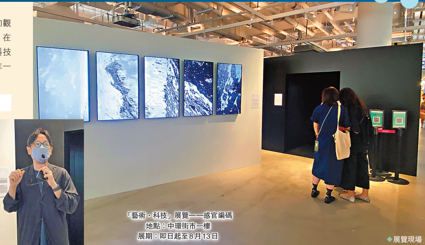
「藝術·科技」展覽——感官編碼 地點：中環街市一樓 展期：即日起至8月13日