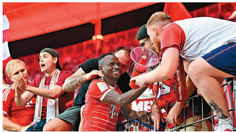
◆ 沙迪奧文尼(中)賽後與球迷一起慶祝勝利。