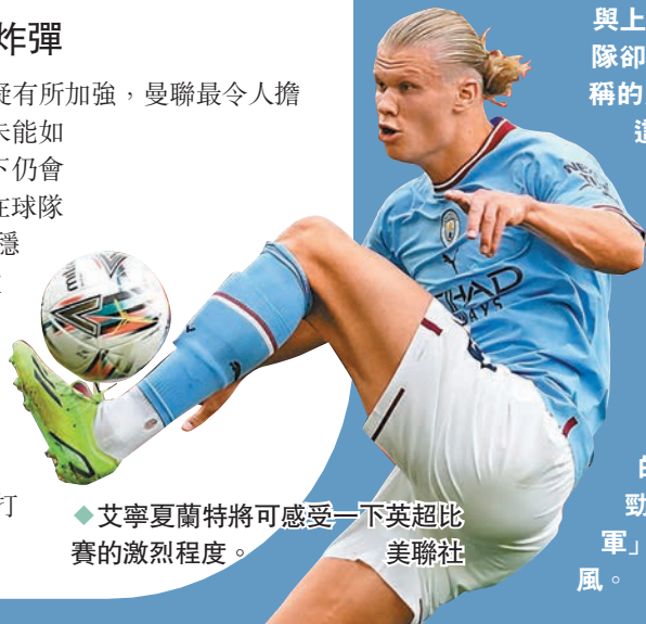
◆ 艾寧夏蘭特將可感受一下英超比賽的激烈程度。