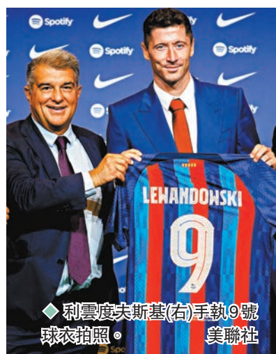
◆ 利雲度夫斯基(右)手執9號球衣拍照。

綜合外電報道 羅拔利雲度夫斯基今夏加盟巴塞隆納，成為球會的新寵兒，他在5日的正式亮相儀式上，獲得數萬巴塞球迷到魯營球場表示歡迎。球會同時宣布，他會取代仍在陣中的迪比成為巴塞9號球衣的新主人，球會主席拉波達坦言這是為了球衣銷售的利益考量，「我們尊重迪比，但這是完全可以理解的，因為是為了巴塞的利益。」