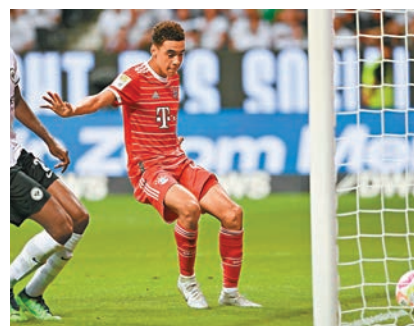
◆ 穆斯亞拿射成4:0。

局。文尼已在上周德國超級盃取得在拜仁的首個正式「士哥」，而對於連續兩場大勝的比賽都有5位不同的球員入球，拿高斯文認為這是利雲度夫斯基離隊後球隊改變打法的鼓舞訊號，「我們在兩場正式比賽中攻入了11球。在利雲度夫斯基離隊後，我們不得不改變一些東西，就是減少傳球。當四五名球員向你跑來時，防守並不容易。」