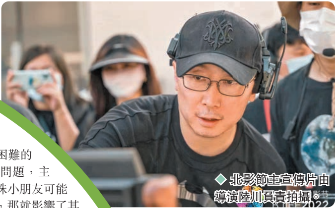
北影節主宣傳片由導演陸川負責拍攝。