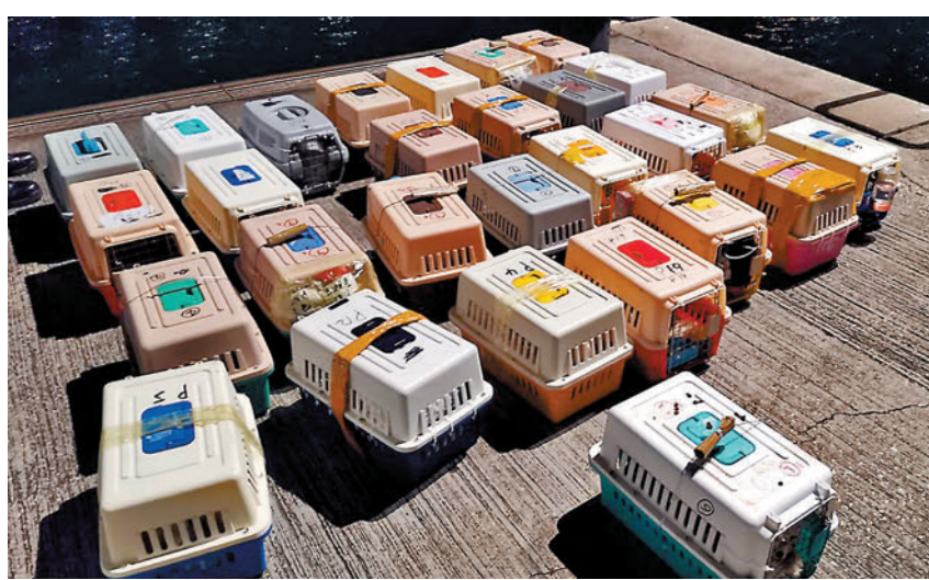
水警檢獲的126隻走私寵物，被分藏於46個狹小便攜式寵物箱，衛生環境非常惡劣。