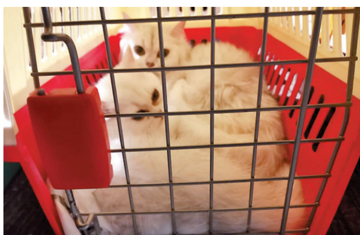
部分寵物出現脫水，全部寵物已交由漁護署照顧。

新冠疫情導致客運及貨運運輸大受影響，一些不法之徒轉而以大批走私方式偷運寵物來港牟利，供本地寵物店售賣。香港警方前晚便破獲今年以來第三宗走私寵物案，在後海灣成功截停一艘非法入境的舢舨，檢獲多達126隻走私的寵物貓狗，牠們被放在狹窄的便攜式寵物籠內，環境非常惡劣，部分更已出現脫水，全部寵物已交由漁護署照顧。案件則由水警總區重案組第一隊繼續跟進，暫未有人被捕。