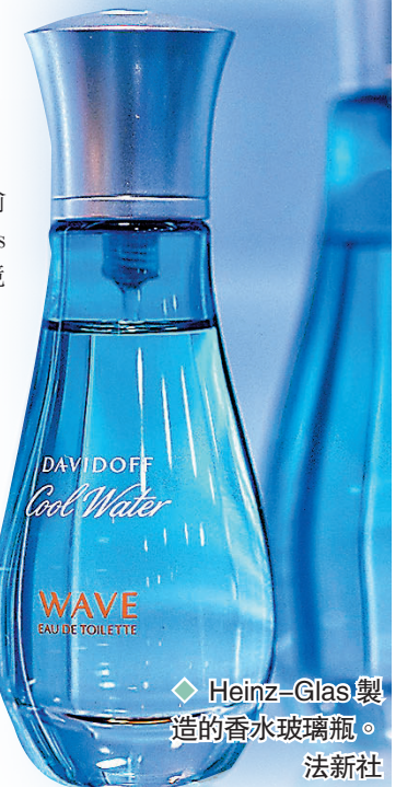
◆Heinz-Glas製造的香水玻璃瓶。

用的能源。過往透過從俄輸入廉價天然氣，Heinz-Glas能將成本壓低，提高出口競爭力，多達八成產量均出口外國，公司每年收入達3億歐元(約24億港元)。隨着近期俄國輸往德國的天然氣大減80%後，Heinz-Glas生產受嚴重影響，需從其他國家購入大量液化天然氣，由貨車運往德國廠房，令成本大增。穆拉特稱，與2019年相比，公司的成本目前高出10至20倍。他同時表示，除了生產受阻外，減少供氣亦令廠房熔爐有受損風險，若將整套系統改為以電力運作，需花費5,000萬歐元(約4億港元)，公司難以負擔這筆投資。