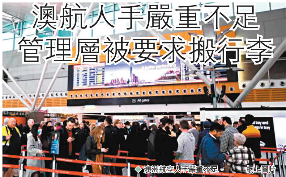
◆澳洲航空人手嚴重不足。網上圖片

澳洲航空因人手嚴重不足，已要求部分中高層管理人員暫時放下日常職責，改為參與地勤工作，包括協助搬運行李，以及駕車將行李從客運大樓運往飛機，需至少100人參與，估計為期3個月。