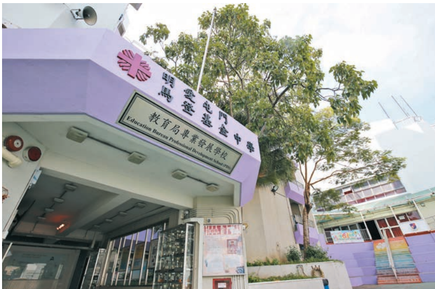
◆明愛屯門馬登基金中學新學年將試行全方位住宿學習計劃。