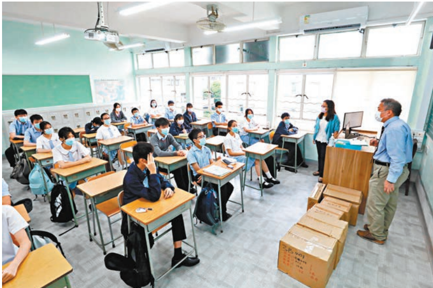
◆本港學生人口下跌，部分學校收生不足，引入內地生或許是出路。

他表示，隨著大灣區深化發展，香港學校也應與時並進，服務大灣區教育所需，「從學生、老師到基礎、高中、高等院校課程，都應作出整合，就是一整個大灣區的概念，達到一幅更完整的大灣區教育藍圖。」