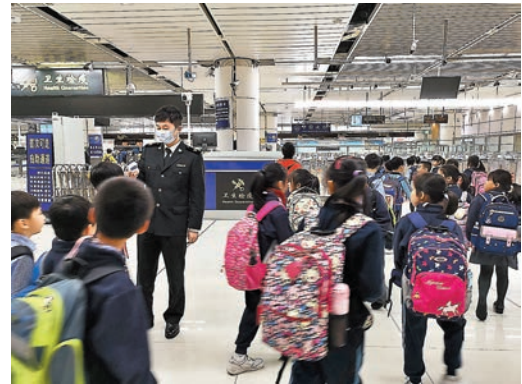
◆疫情影響跨境生來港學習。圖為疫情前跨境學童過境情況。 資料圖片