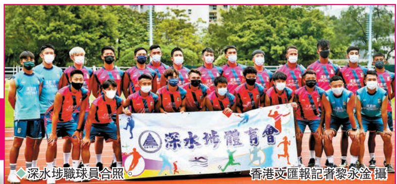
◆深水埗球員合照。