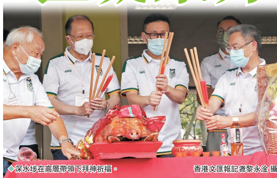
◆深水埗在高層帶領下拜神祈福。