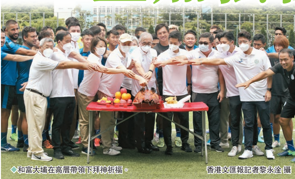
◆和富大埔在高層帶領下拜神祈福。