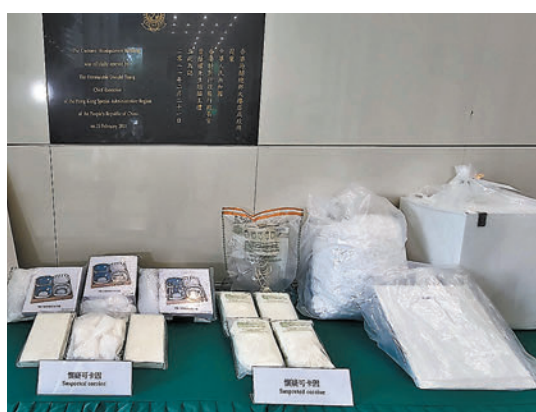
◆海關行動中共檢獲7公斤可卡因，市值約640萬元。

是案5名「612基金」信託人今年5月初被指違反香港國安法，涉嫌與外國反華滲透勢力有資金往來、支援香港黑暴及反政府活動，亦涉嫌請求外國或者境外機構對香港特別行政區實施「制裁」，干犯串謀勾結外國勢力或者境外勢力危害國家安全罪被捕，5人其後獲准保釋。同月24日，5人與施城威各被票控一項沒有在指明時限內申請註冊或豁免註冊社團罪，在西九龍裁判法院提堂。