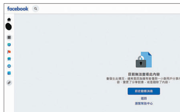
◆Facebook上的「公務員Secrets」群組昨晚已經關閉。

測陽性結果行動中，拘捕一名救護員和其女友，涉嫌在衛生防護中心網上申報系統，提供虛假的快測陽性結果，從而獲發隔離令。其中，38歲救護員利用虛假的快測陽性呈報，涉嫌欺詐消防處，其35歲女友同時干犯第599A章《預防及控制疾病規例》第32條，使其他人蒙受感染的危險。