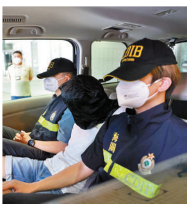
◆海關拘捕一名18歲青年。