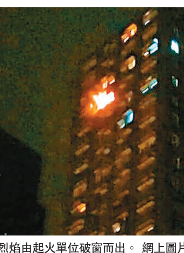
◆烈焰由起火單位破窗而出。

現場消息指，事發時肇事單位的客廳首先起火，其後蔓延至睡房，幸戶主夫婦及時醒來逃生。火警期間，大廈共有80名住客，包括55男25女要疏散到安全位置。單位起火原因仍有待調查。