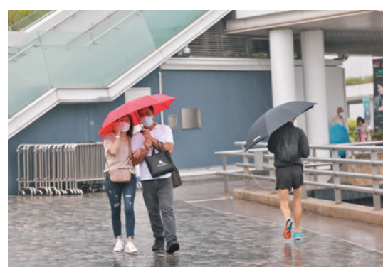
◆三號風球下，冒着風雨外出的市民狼狽不堪。

香港文匯報訊（記者 蕭景源）熱帶風暴「木蘭」昨晚9時進入香港460公里範圍，以時速約18公里移向廣東西部至海南島一帶，並逐漸增強。天文台昨日表示，與「木蘭」相關的廣闊外圍雨帶正影響南海北部及廣東沿岸，預測今日香港有狂風大驟雨及雷暴，展望隨後兩三日仍然有驟雨，至周初短暫時間有陽光。