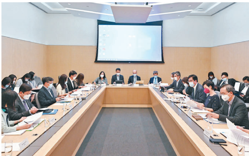
◆公營房屋項目行動工作組昨日舉行第三次會議，進一步討論提升及加快公營房屋整體供應的具體工作路向。