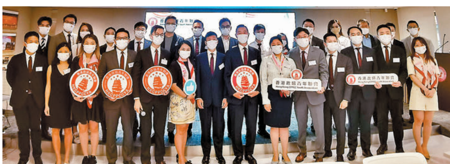
◆香港政協青年聯會昨日舉辦傳媒交流會，介紹未來工作重點和活動。

例風波被判囚，但願意改過自新的年輕人重新融入社會。在過程中，該會將安排青年委員到監獄探訪正在服刑的青年並了解他們的需求，並協助他們配對適當工作等。