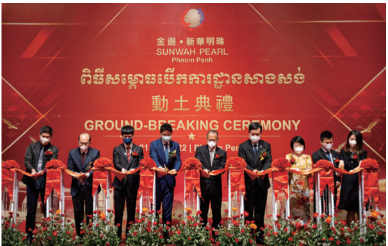
▲新華集團在金邊總投資逾15億美元，建築面積達46萬平方米的房地產項目「新華明珠」，舉行動工儀式。