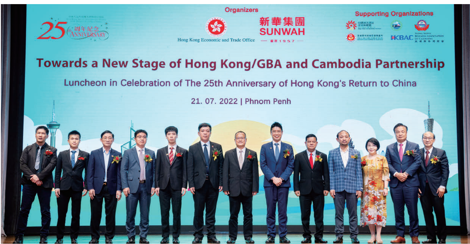
▲7月21日，新華集團與香港特區駐泰國經濟貿易辦事處在東埔寨金邊聯合舉辦「香港粵港澳大灣區與東埔寨合作夥伴關係邁向新台階」午餐會。