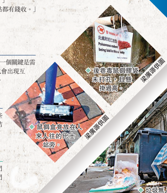
後巷毒鼠膠袋未打孔，但懸掛過高。