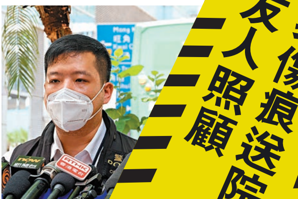
警方交代3個月大男嬰疑遭虐殺案件詳情。