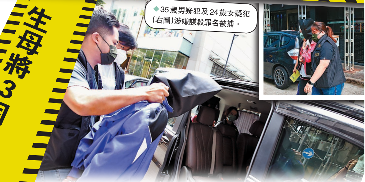
35歲男疑犯及24歲女疑犯(右圖)涉嫌謀殺罪名被捕。