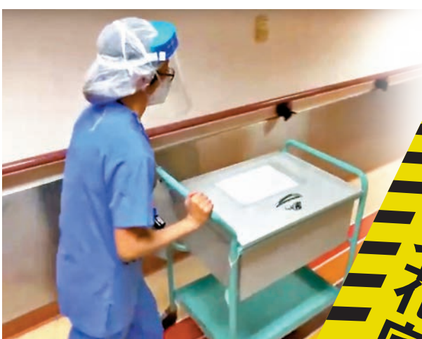
男嬰遺體被推往停屍間。

旺角警區助理指揮官(刑事)署理警司趙炳輝昨日表示，警方初步相信遇害男嬰身上灼傷傷痕並非由煙頭造成，但初步可見其身上出現的水泡，有可能是由熱水或發熱電器所致。警方現循「謀殺」、「疏忽照顧兒童」及「虐待兒童」三個方向調查，同時會追查被捕夫婦的精神紀錄及精神狀態。