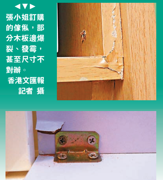
張小姐訂購的傢俬，部分木板邊爆裂、發霉，甚至尺寸不對辦。