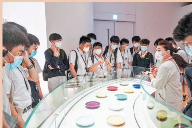
◆學生觀看中國歷代陶瓷精品。