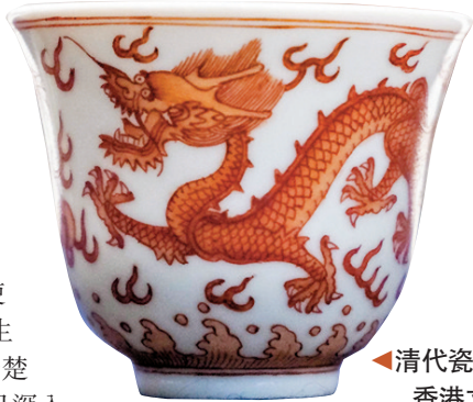
◀清代瓷器

他透露，聖若瑟英文中學正籌備設立中史文物展示活動教室，並已斥資數萬元購買100多個仿製文物，以及為相關文物出版了《文物裏的中國歷史》教材，以配合中史課程教學，讓同學感受不同時代文物的實地和特色，從多角度認識歷史和文物，讓中史學習不再沉悶。