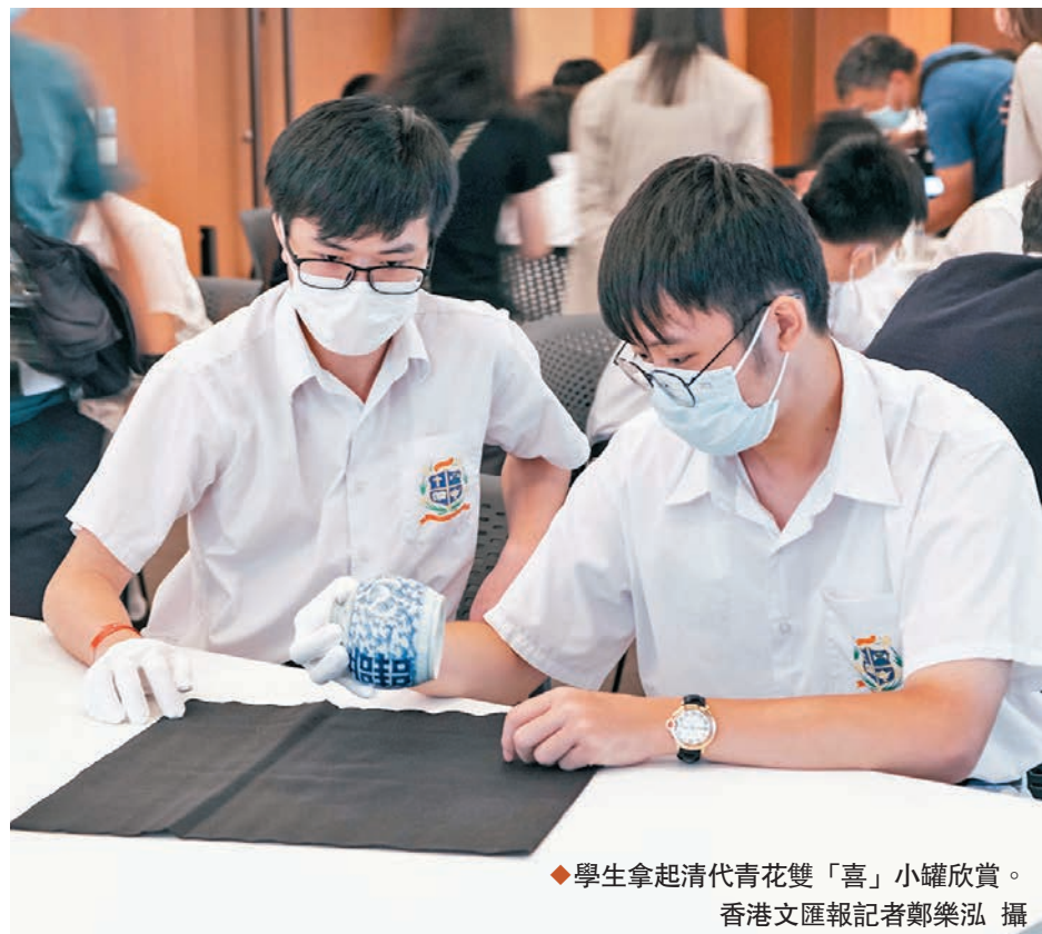
◆學生拿起清代青花雙「喜」小罐欣賞。