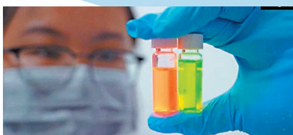
量子點材料的成本不斷降低。