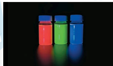
量子點材料極具光電特性。