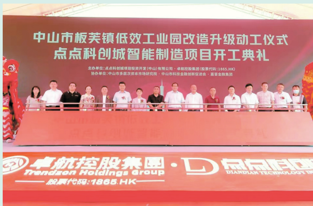
◆因看好深中通道和中山科學城發展機遇，許多香港上市公司和深圳企業紛紛進駐中山卓航點點科創城，圖為該項目開工儀式。

《粵港澳大灣區發展規劃綱要》提出將粵港澳大灣區打造成「具有全球影響力的國際科技創新中心」，除了香港、深圳、廣州等作為核心城市外，東莞、佛山和中山等城市也成為大灣區國際科創中心的重要支點。廣東省正在加快建設廣中珠澳科技創新走廊核心平台，而作為中山科學城重要片區的板芙鎮卓航點點科創城智能製造項目近日在中山正式開業。