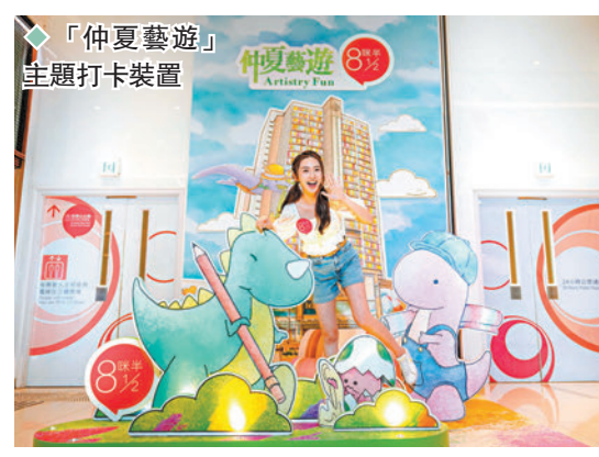
「仲夏藝遊」主題打卡裝置