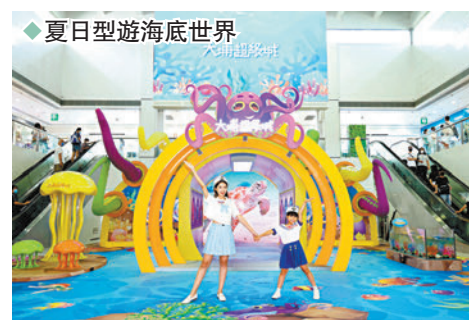
夏日型遊海底世界

五個互動體驗專區，如「海洋先鋒潛艇」、「巨型空中飛魚」、「遙控深海魚體驗」、「互動體感人造沙灘」及「鯨魚探險區」等，讓大家體驗藍色大海之美。商場更推出多個消費獎賞活動，顧客憑電子消費券於場內消費，盡享多重購物禮遇，包括「夏日感謝月」低至HK$1換購限量潮物及「消費券多重賞」等。 例如，來到「海洋先鋒潛艇」，踏進1:1的海洋潛艇，開始進入海底隧道冒險之旅；逾4米高的全景及兩側螢幕實時帶大家由水面360°全方位觀賞海龜、水母、珊瑚等悠遊的畫面。顧客與海洋生物玩樂之際，牠們更會送上「見面禮」，只要野生捕捉帶有二維碼的海洋小生物，掃描兼答對3條與海洋奧妙相關的問題，即有機會獲得電子美食優惠券等。