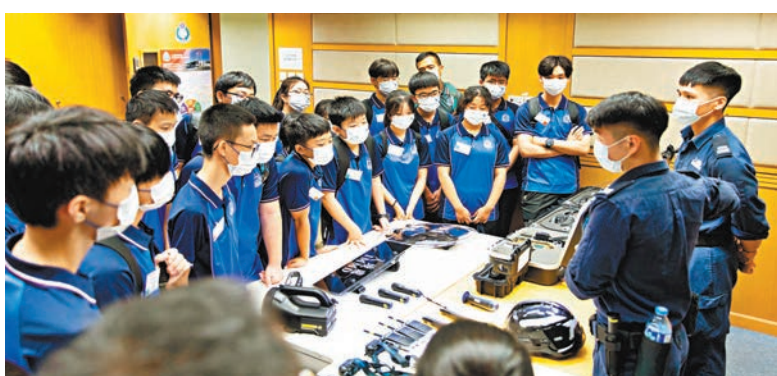
◆營友到訪港口管制組船隻搜查隊，認識入境處的港口管制工作。

入境事務處處長區嘉宏、副處長郭俊峯、戴志源，「入境事務處青少年領袖團」總監鄭錦鐘等出席典禮。他們勉勵隊員們養成愛國愛港的情操，從而建立遵守法律的品格，成為香港的良好市民和社會未來的棟樑，與入境處一同為祖國、為香港作出貢獻。