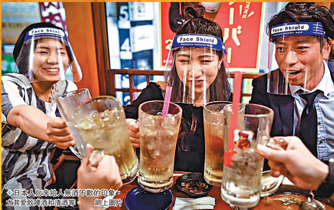
◆日本人向來給人無酒不歡的印象，尤其愛飲啤酒和清酒等。