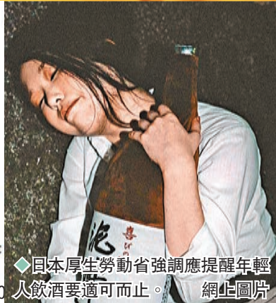
◆日本厚生勞動省強調應提醒年輕人飲酒要適可而止。網上圖片