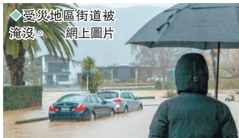
◆受災地區街道被淹沒。網上圖片