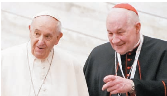
◆韋萊(右)是教宗方濟各核心圈子成員。

這是韋萊首次面對性侵犯的法律控訴，一名在事發時隸屬魁北克教區但不願透露身份的神父表示，有關韋萊不恰當行為的傳聞早已傳聞，所以他相信「F」的控告是真實。梵蒂岡和魁北克總教區尚未就集體性侵犯指控作回應。集體性侵犯民事訴訟的超過100受害人，大多在上世紀五六十年代遭到神職人員性侵，而案發時大多數受害人均未成年。