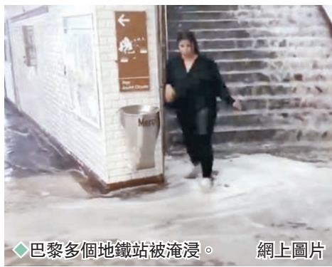
◆巴黎多個地鐵站被淹沒。