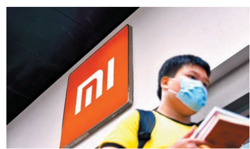
小米上季收入按年跌逾20%。