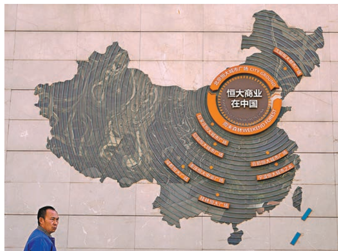
近日泉州金控集團與恒大簽訂了託管協議，正式受託接管其6個項目後續工程建設、銷售及其他相關事項管理。