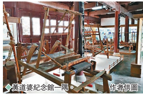
黃道婆紀念館一隅。

黃道婆——這位對中國傳統棉紡織業擁有突出貢獻的勞動婦女，不啻被奉為「衣被天下」的民間科技先驅和大國工匠，也是一位傑出的民族交際文化使者。此番在海口美蘭機場出關通道，見走廊「海南歷史人物展」中赫然就有黃道婆推介，說她在瓊島40年潛心學藝、知行合一，完美體現了中華民族「海納百川、追求卓越、開明睿智、大氣謙和」的精神氣質和歷史功勳。因虛心向海南人刻苦學習掌握了先進的製棉工具和紡織技術，繼而向內地傳授推廣海南紡織技術並研製出先進的紡織器械而著稱於世，黃道婆深獲各地民眾敬仰，被尊為「布業始祖」。如今上海、寧波一帶的傳統紡織企業，每每都敬奉有黃道婆塑像或畫像。