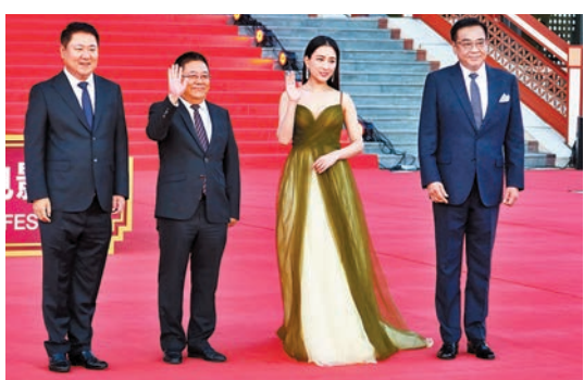
◆「天壇獎」入圍影片《海的那邊是草原》劇組走紅毯。

張頌文去年是「天壇獎」評委，今年是「天壇獎」頒獎嘉賓。他受訪時表示，不管在什麼位置，只要是電影人就開心。他還在現場向年輕演員支招：「電影行業需要我們這些正在其中的人開拓創新。我也從年輕演員過來，也曾覺得機會不是很好，但其實每個時間節點都提醒你要努力，你無法左右結果，但你可以左右自己的努力。」張頌文還