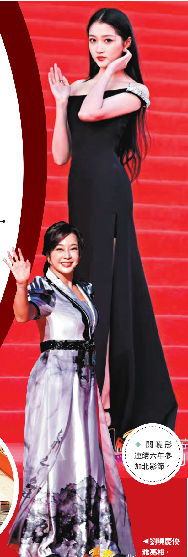
◆關曉彤連續六年參加北影節。