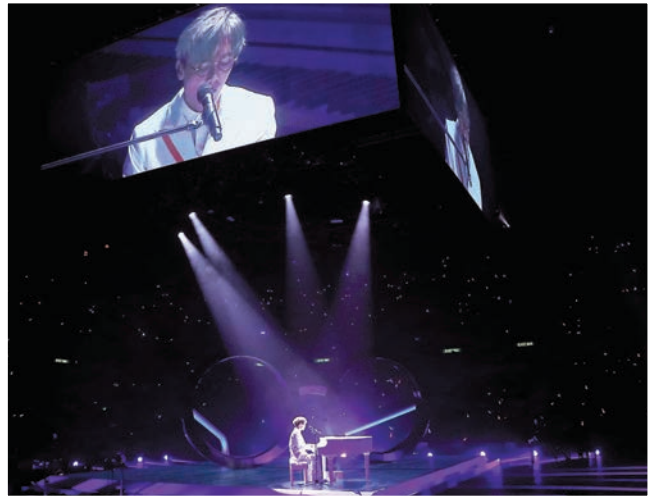
◆舞台頂部下方另有4塊投射用的屏幕改用薄身屏幕。