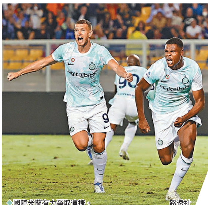
◆ 國際米蘭有力爭取連捷。

國際米蘭上週聯賽雖差點失分，但最終仍靠後備上陣的翼衛杜費斯於補時建功，成功擊敗萊切贏波，相信這場勝仗有助球員取得信心。從上週比賽所見，由車路士回歸的盧卡古似乎很快便再次適應意甲節奏，更順利取得入球，以這位比利時國腳和其拍檔拿達路馬天尼斯的級數，「國米」攻力不用懷疑，配合球隊今季首度於主場出擊，肯定希望以一場大勝取悅球迷。 將有前鋒費尼斯安迪斯迪因傷缺陣的史柏斯亞，上週主場擊敗安波里，但今晚缺少主場之利能否保持水準卻成疑，因史軍上季意甲作客戰績僅為5勝3和11負，在19戰中失掉41球之多，如此水準出訪米蘭自然難以看好。