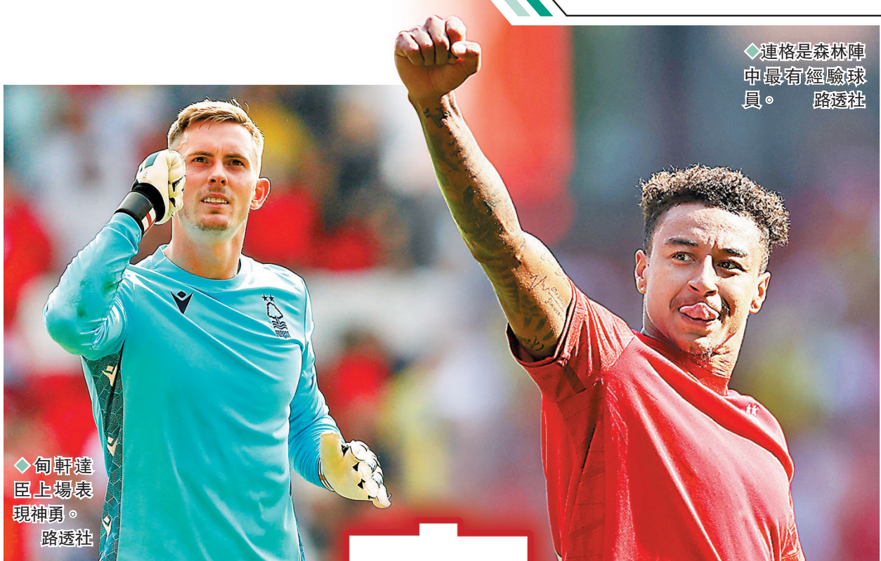
◆ 甸軒達臣上場表現神勇。