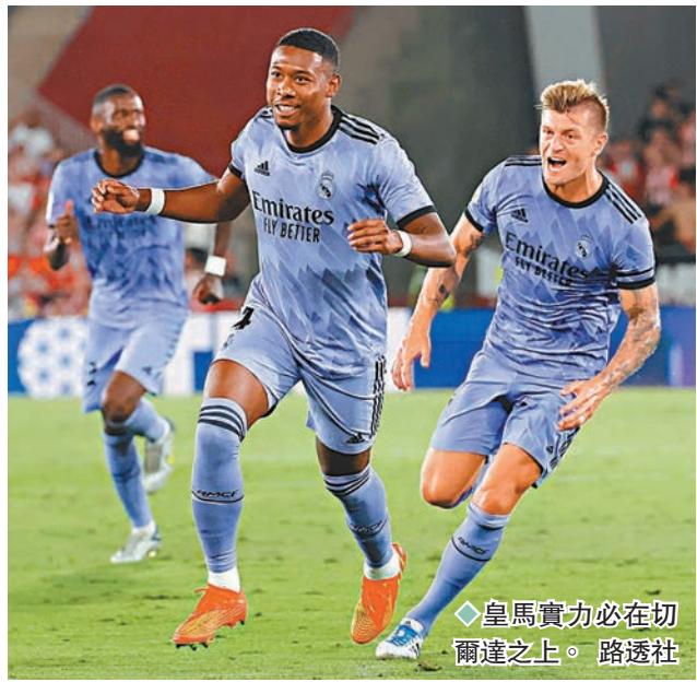
◆ 皇馬實力必在切爾達之上。

香港文匯報訊（記者 楊浩然）衛冕西甲的皇家馬德里，將於香港時間週日凌晨輪聯賽出訪切爾達，在兩軍級數有別下，皇馬只要發揮水準勢穩獲3分。（now632台周日4:00a.m.直播）