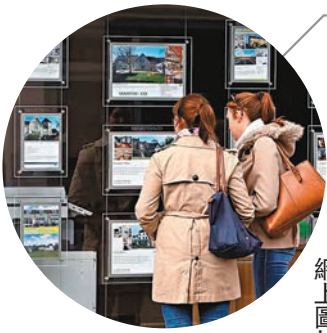
◆英國國家公園內的房價被推高，一般年輕人難以負擔。網上圖片