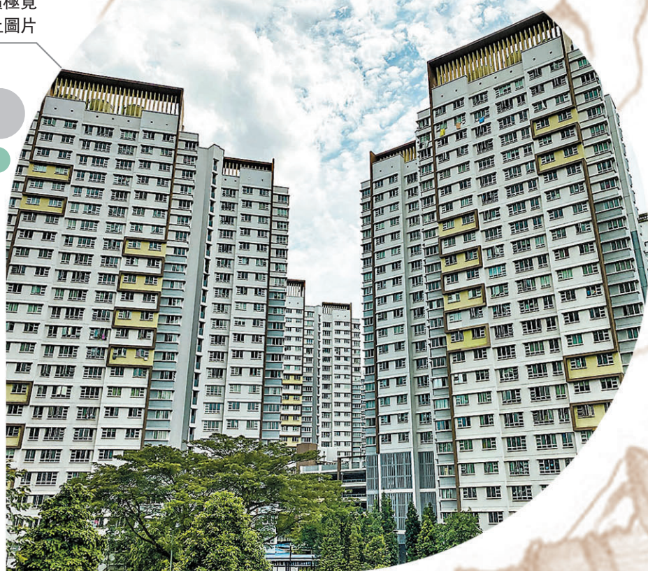
◆新加坡政府近年積極覓地建屋。