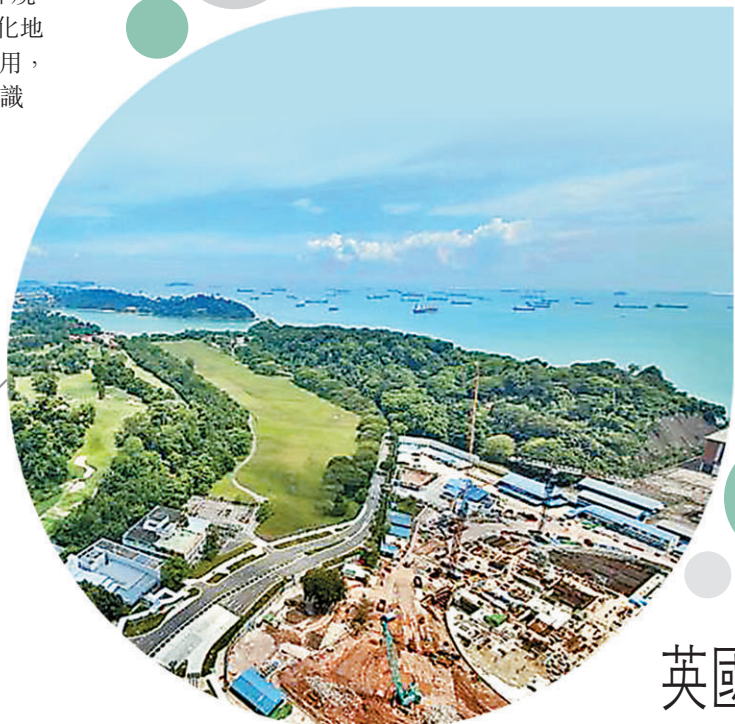
◆新加坡估計有合共約236公頃的高球場會陸續被徵收。