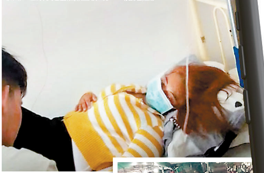
◆A姐姐抵達柬埔寨後的第一周，仍顯示與友人在地攤飲食，不過其後再獲悉其傳回照片時，已顯示她躺在床上吊鹽水。視頻截圖

據台灣地區的傳媒報道，柬埔寨明年將主辦東南亞運動會，該國擬下月進行掃蕩大行動。詐騙集團趕緊連同豬仔拋售，或會轉賣予其他地區的幫幫接手，最糟的情況是乾脆將豬仔就地處理掉，以免豬仔日後指證他們。