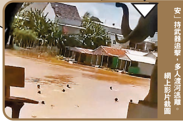
◆大批工人逃出賭場大樓，被「保安」持武器追擊，多人渡河逃離。網上影片截圖

據越南傳媒報道，在接壤柬埔寨邊境的越南安省一處河邊發現一名16歲少年的屍體，相信他是跳河逃出柬埔寨一間賭場時，被河水沖走的一名越南籍員工。警方表示正進行調查，要完成驗屍後才會將遺體交還給家屬。