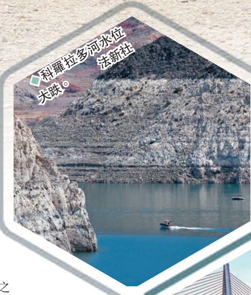
科羅拉多河水位大跌。

科羅拉多河缺水危機的後果非常嚴重，原因是有多達7個州份及鄰國墨西哥部分地區共約4,000萬人，都是依賴它的河水作飲用、農業灌溉及發電。由於高溫乾旱天氣持續，美國墾務局已呼籲該7個州份至少在未來四年都要節約用水。