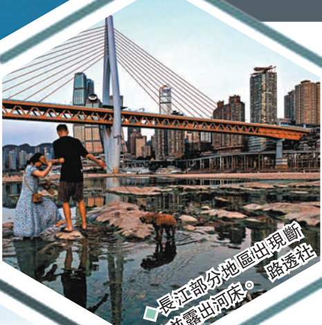
長江部分地區出現斷流並露出河床。

除四川外，安徽、浙江、江蘇等地也面臨電力供應緊張局面。目前浙江寧波3,300多家企業已主動響應國家電網错峰用電需求，調整生產計劃。安徽省合肥市則稱今夏全市電力供需形勢緊張，倡導工業企業要科學合理安排生產班次，主動支持緩解用電高峰時段供電壓力。