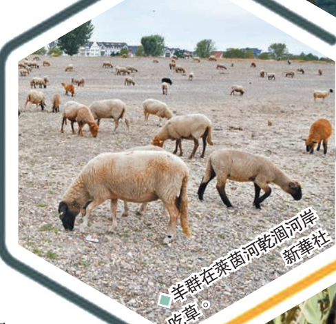
羊群在萊茵河乾涸河岸吃草。

「德國工業聯盟」警告稱，萊茵河低水位現象若沒有改善，供應鏈和生產將受到影響，化工和鋼鐵業遲早被迫關廠，政府用煤炭取代天然氣的規劃，也將因裝載煤炭的貨輪無法航行難以實施。在缺乏水資源的狀況下，水力發電產量告急，需要大量水資源降溫的核能發電也面臨停機，歐洲能源短缺狀況只會逐漸加劇。