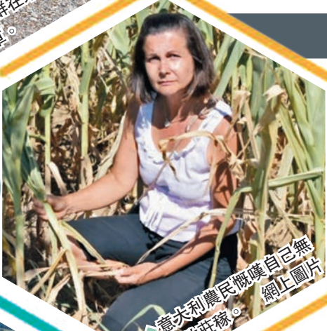
意大利農民慨嘆自己無力挽救莊稼。

意國最大三角洲波河三角洲因旱災和異常炎熱天氣，導致水分的含鹽量過高，嚴重影響當地稻田耕作，加上部分水道乾涸，兩棲動物和鳥類棲息的濕地也日益縮減。波河盆地管理局表示，當地整個生態系統或受到永久影響。