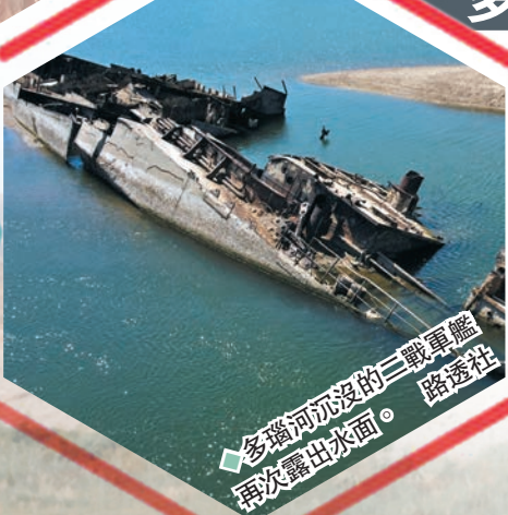
多瑙河沉沒的二戰軍艦再次露出水面。

在塞爾維亞東部普拉霍瓦，超過20艘二戰時期沉沒的德國軍艦再次露出水面，這批軍艦屬於納粹德國黑海艦隊，相信是1944年期間沉沒，並載有數噸彈藥和爆炸品。外界擔心會對當地航運、漁民以及生態環境構成風險，當局正嘗試打撈及拆除艦上彈藥。