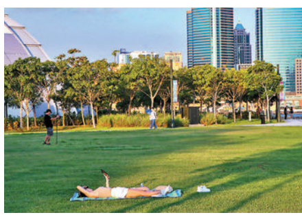
◆雖然熱帶風暴「馬鞍」逐漸逼近香港，但昨日仍有不少市民到西九文化區散步及曬太陽。香港文匯報記者攝

天文台表示，雖然「馬鞍」登陸位置仍不確定，但會較為接近香港，預料明天(周三)稍後天氣轉壞，海有湧浪，晚間風勢逐漸增強。天文台又提醒，後日可能會受風暴潮吹襲，唐宇輝表示：「由於周四(25日)正值天文大潮，如果「馬鞍」