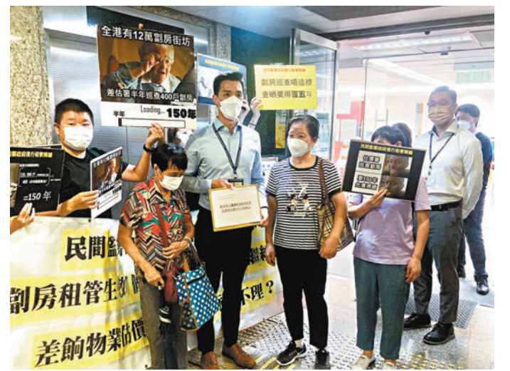
◆「民間監察政府推行租管陣線」成員昨日與租戶到長沙灣差估署門外遞交請願信，促請署方加強巡查打擊濫收租金。

差估署正調查當中198宗個案，會因應個別涉嫌違規個案及所收集的資料徵詢律政司意見，決定是否採取法律行動。至於其餘58宗個案，因租客拒絕向該署提供進一步資料，故未能繼續跟進。