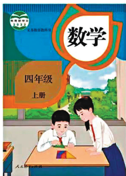
◆新繪製人教版小學數學教材一至六年級上册教材封面。