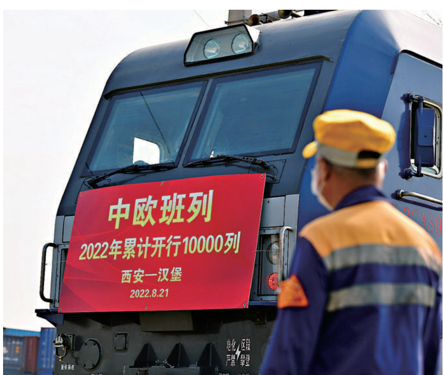
◆今年以來中歐班列累計開行突破1萬列。