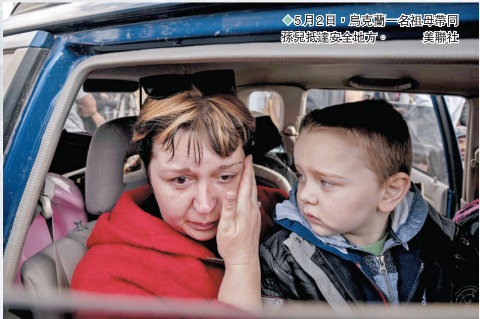
◆5月2日，烏克蘭一名祖母帶同孫兒抵達安全地方。

5514人 聯合國估計截至8月中俄烏衝突造成的平民死亡人數，但聯合國亦承認這個數字被低估。烏克蘭政府則估計，截至8月初約有1.2萬至2.8萬名烏克蘭平民死亡。