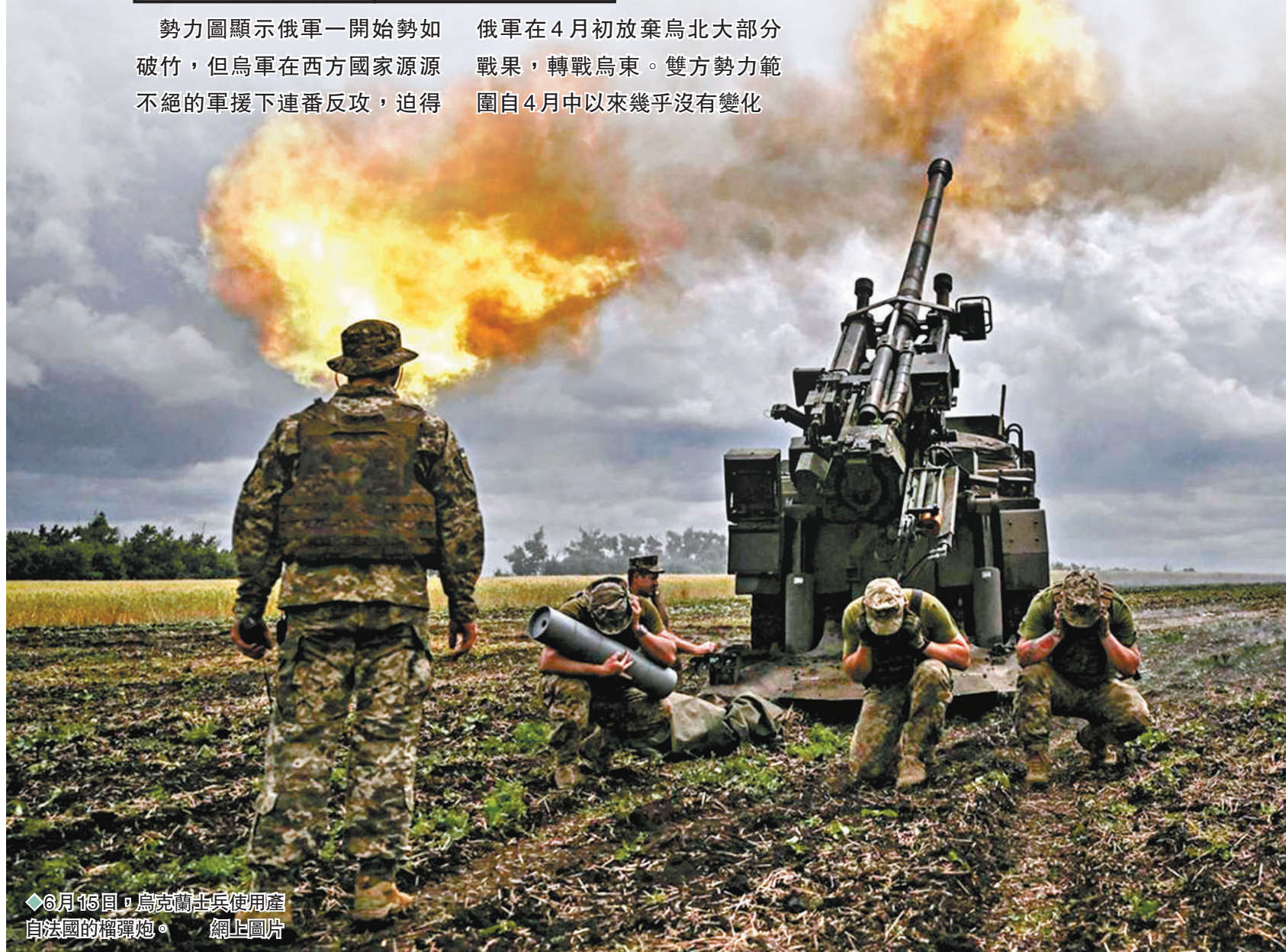
◆6月16日，烏克蘭士兵使用產自法國的榴彈炮。網上圖片

勢力圖顯示俄軍一開始勢如破竹，但烏軍在西方國家源源不絕的軍援下連番反攻，逼得俄軍在4月初放棄烏北大部分戰果，轉戰烏東。雙方勢力範圍自4月中以來幾乎沒有變化。