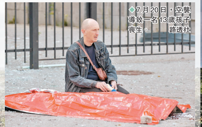
◆7月20日，空襲導致一名13歲孩子喪生。