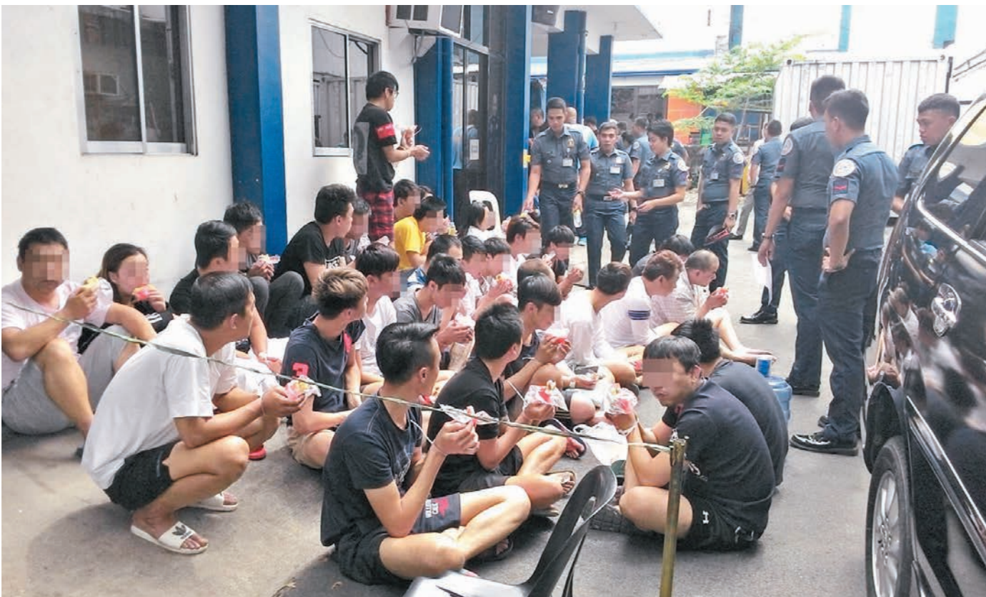
◆菲律賓警方早前掃蕩電信詐騙集團，均捕至少40名台灣籍詐騙疑犯。