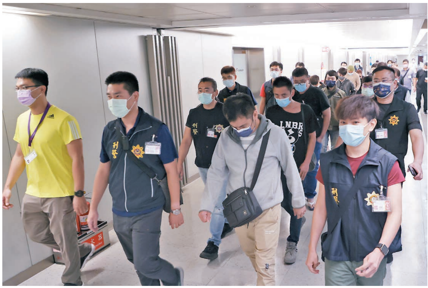
◆本月中，9名初步鑑定為台灣籍的詐騙案受害人由柬埔寨經泰國返回桃園機場。

三線話務員一般由台灣人擔任，主要是提供銀行賬號。他們在詐騙中的身份主要是冒充檢察官，炮製被害人已被逮捕或資產被凍結的刑事逮捕令凍結管制令，騙取被害人將銀行卡內所有錢款轉至所謂的「安全賬戶」內，並提供銀行賬號給被害人。一旦被害人將自己銀行賬戶中的錢款轉到所謂的「安全賬戶」，該詐騙團夥即成功騙得被害人的錢款。而在此過程中，三線騙徒還會根據受害者賬戶錢款多少決定使用什麼賬戶，例如被害人金額較少，會被轉到一個一直使用沒有被凍結的賬號，如被害人金額較大，就會選擇一個沒有用過的新賬號。但這些賬號下一般還會關聯數量不等二級甚至三級賬戶，一旦有錢進入賬戶立即會被轉得一乾二淨。