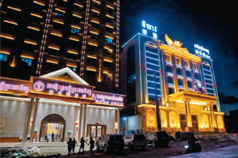
◆柬埔寨西港是詐騙案集中地。

香港文匯報記者梳理相關裁判文書發現，這些詐騙集團內部組織嚴密、層級分明，有嚴格的工作制度和獎懲制度。分工明確，集團人員根據分工不同主要分為三級：第一級為幕後台灣老闆；第二級為現場管理人員及電腦維護人員，一般第二級人員20人至30人