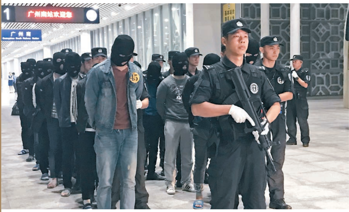
◆廣東警方將嚴厲打擊台灣籍電騙犯罪團夥。圖為警方押解電信詐騙疑犯。