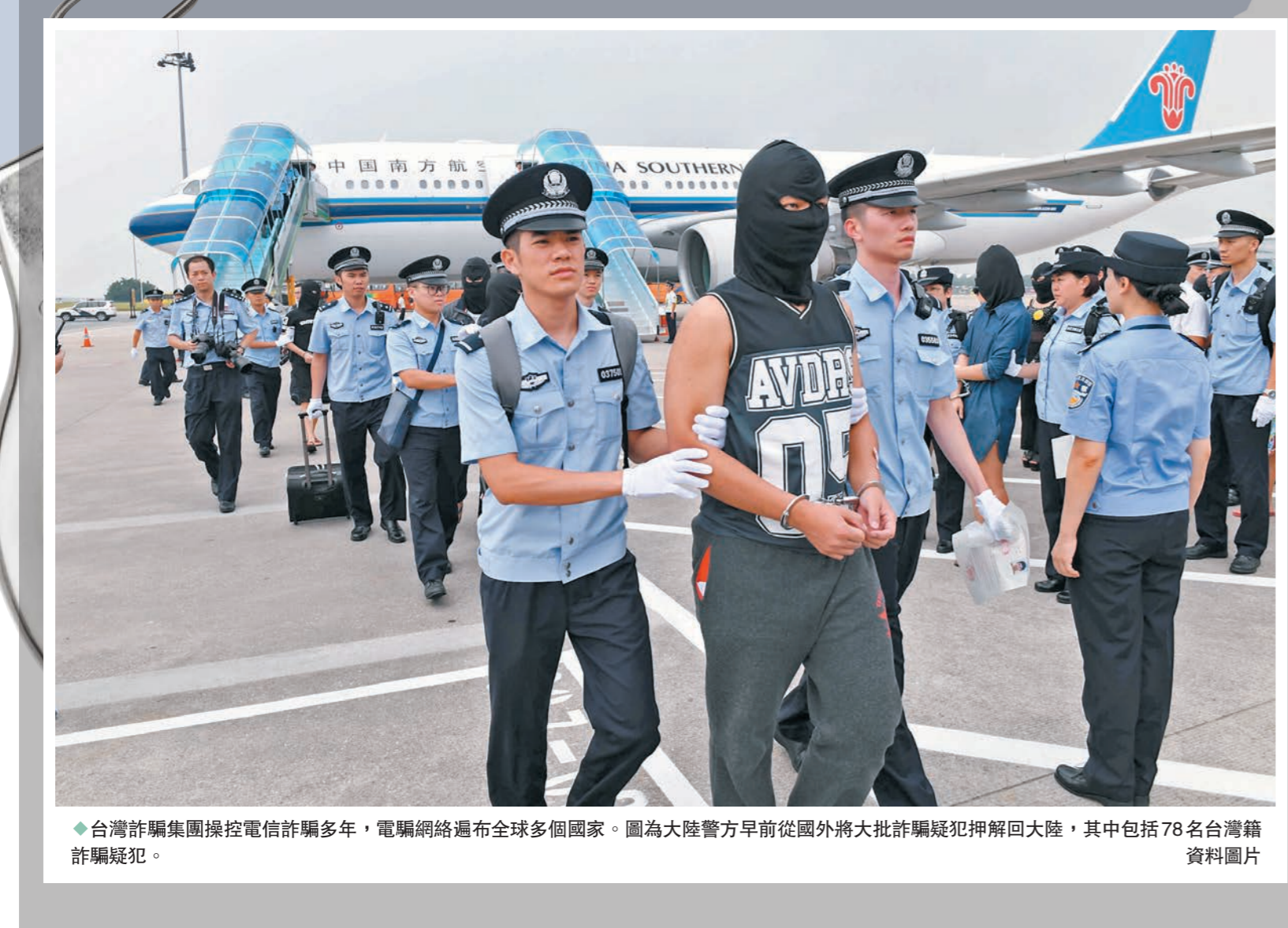
◆台灣詐騙集團操控電信詐騙多年，電騙網絡遍布全球多個國家。圖為大陸警方早前從國外將大批詐騙疑犯押解回大陸，其中包括78名台灣籍詐騙疑犯。