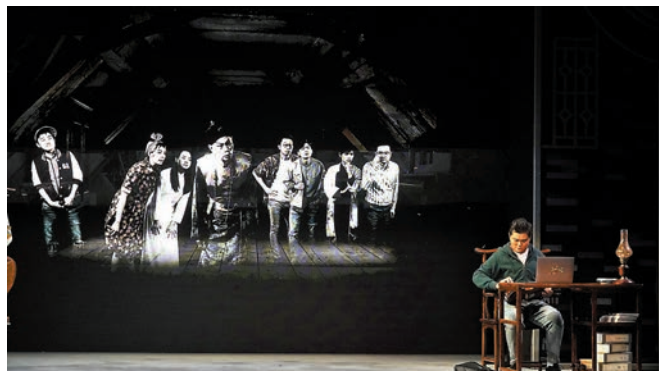
舞台上使用了影像投射技術。