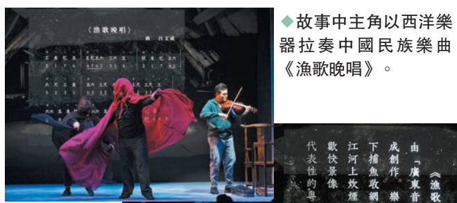
故事中主角以西洋樂器拉奏中國民族樂曲《漁歌晚唱》。