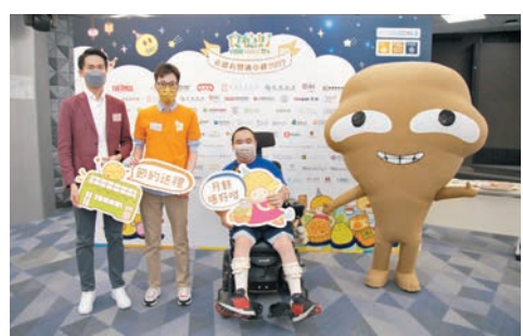
◆調查顯示，去年平均每個香港家庭浪費1.74個月餅。

另外針對月餅過度包裝問題，超過八成受訪者認同情況嚴重及非常嚴重，近七成人有將月餅包裝物回收，亦有不少人表示要視乎回收點是否便利而回收廢棄包裝物。