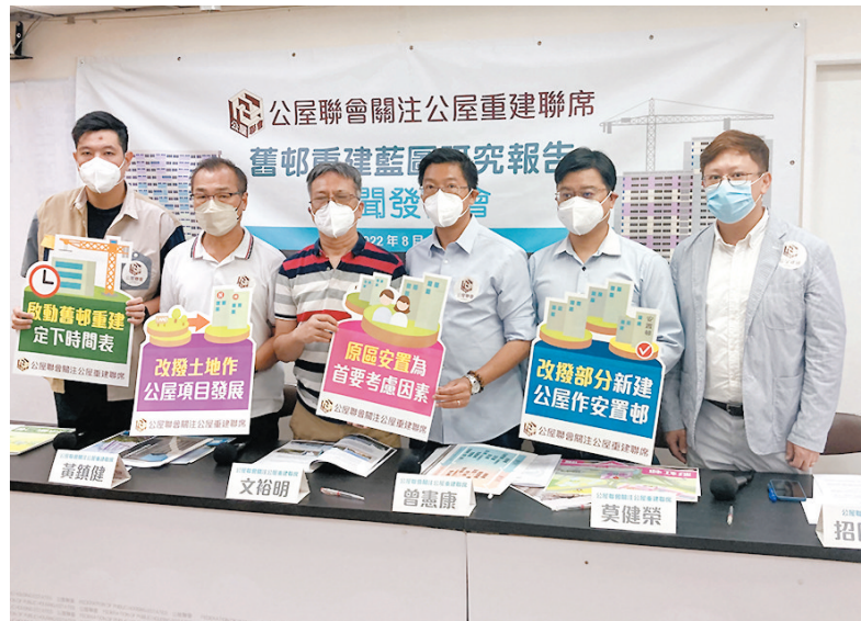
◆公屋重建聯席昨日公布《舊邨重建藍圖研究報告》，促政府未來十年分兩階段重建14條舊屋邨。

不少高齡公屋出現石屎剝落及漏水等問題，期盼早日重建的呼聲愈來愈大。公屋聯會轄下關注公屋重建聯席昨日公布《舊邨重建藍圖研究報告》，促請特區政府在未來十年分兩階段重建14條舊屋邨，首階段2022/23年至2026/27年，優先重建8條屋邨(見表)，包括樓齡已屆60的西環邨、和樂邨、馬頭圍邨。聯席指上述舊屋邨附近未來有公營房屋發展項目，一旦8屋邨重建，這些發展項目可安置受影響居民，聯席指出重建舊屋邨既改善居住環境，亦有助增加更多公營單位，補足單位不足情況，盼政府盡快開展重建工作。