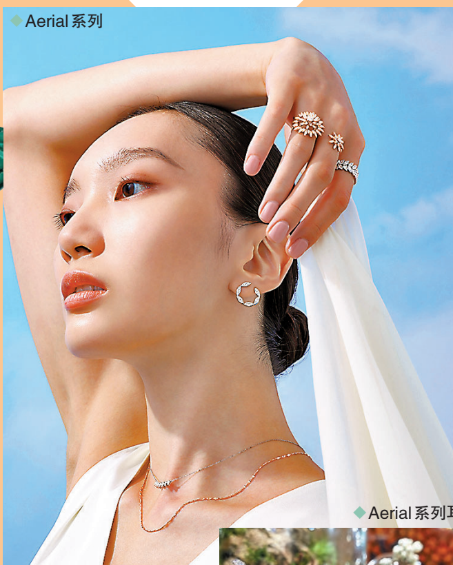
◆ Aerial 系列