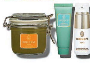
▲ 皇牌美膚泥漿——限時體驗套裝