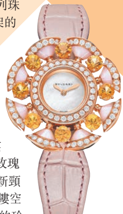
◆ Divas' Dream 腕錶

香港國際珠寶展剛完，第41屆香港鐘表展及第10屆國際名表薈萃又將至，今年將以全新融合展覽模式「EXHIBITION+」（展覽+）舉行，實體展由9月7日至11日於灣仔會議展覽中心舉行，網上展則延續至9月18日。讓愛錶人士觀賞精湛的工藝及選購心儀腕錶。瑰麗名錶、珠寶首飾又再進入市民的眼簾。