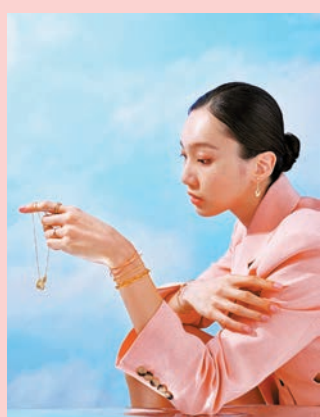
◆ 「The Gentlewoman」系列珠寶

周大福「The Gentlewoman」系列，靈感來自「Gentleman」，代表着新世代女性可同時展現優雅氣質且獨立瀟灑的魅力，具備細膩心思之外，亦帶堅韌果敢。這系列設計富女性元素及線條美感，其中的耳環及項鍊均以利落線條及精細工藝打磨，凸顯 18K 黃金首飾的獨有氣派，散發魅力四射的新女性個性，為追求品味、喜歡特色配搭的你找到今個夏日的時尚方程式。