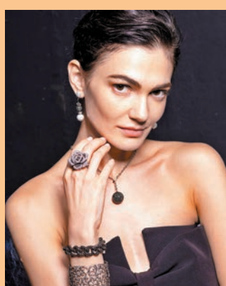
◆ Day Night 系列

景福珠寶推出的 Day Night 系列，呈獻不同外形輪廓的頸鏈、手鐲、耳環及戒指款式，既有線條分明的幾何形狀設計，亦有糅合弧線與圓形的柔和設計，從簡約利落到結構複雜精緻的多元化選擇，讓女士們隨心挑選，展現自己的品味。要突顯專屬的時尚觸覺，只需將多款不同色調與設計的 Day Night 系列鑽飾自由搭配出層次感，即可拼湊出千變萬化的可能性，不需浮誇閃爍的包裝，為都會女性在日常造型錦上添花，以個人品味的配搭展現真我。