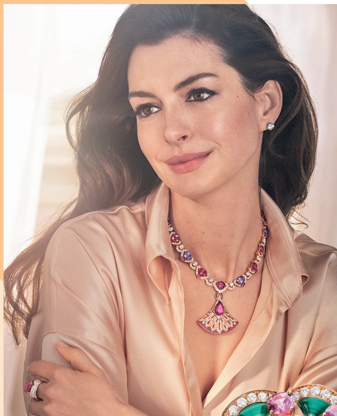
◆ Divas' Dream 系列