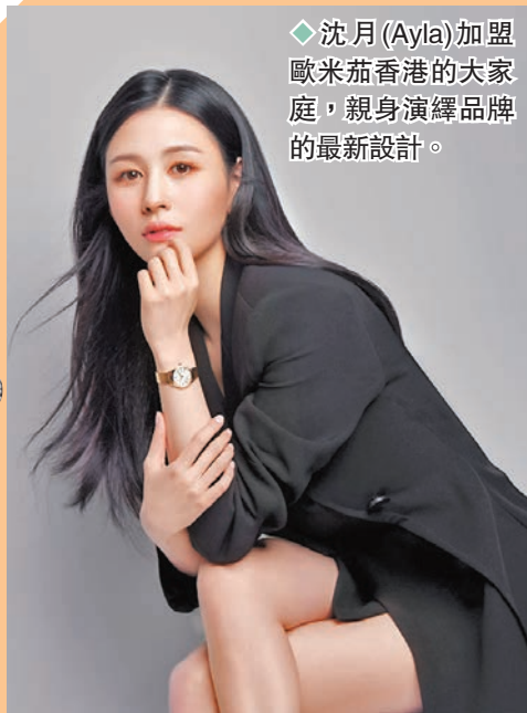
◆ 沈月 (Ayla) 加盟歐米茄香港的大家庭，親身演繹品牌的最新設計。