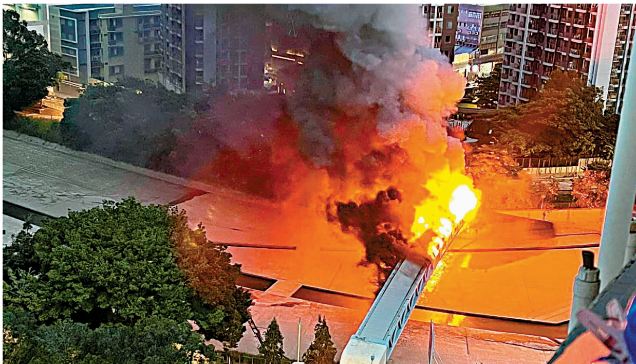
中電調查報告認為，橋內橫樑的光管起火，火種跌落通訊電纜引起燒橋事故。

經過兩個月調查，中電昨日公布元朗電纜橋起火事件的最終報告，推斷起火源頭為天花橫樑上有熒光燈起火，火種跌落下方的通訊電纜再蔓延，終釀成大火。中電多次形容事件「非常罕見」，並排除起火原因與電纜超負荷、炎熱天氣及不正當行為有關，但始終未能確定熒光燈的起火原因。中電表示，中電會在地底重建電纜，預計一兩年完成，並已為餘下4條電纜橋加裝一系列防火裝置及更換所有熒光燈。中電表示，下月中旬將向受影響客戶派發100元的心意券，但未回應是否有人要為事件負責。