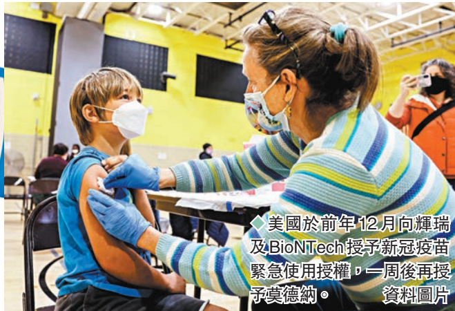
美國於前年12月向輝瑞及BioNTech授予新冠疫苗緊急使用授權，一周後再授予莫德納。

美國藥廠莫德納昨日表示，正對另一藥廠輝瑞及其德國合作夥伴BioNTech提出訴訟，指控後兩者在研發新冠疫苗時侵犯專利，抄襲莫德納在疫情前數年開發的技術。