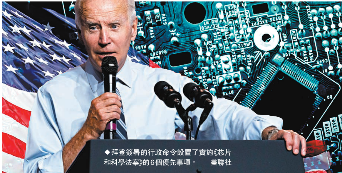
◆拜登簽署的行政命令設置了實施《芯片和科學法案》的6個優先事項。