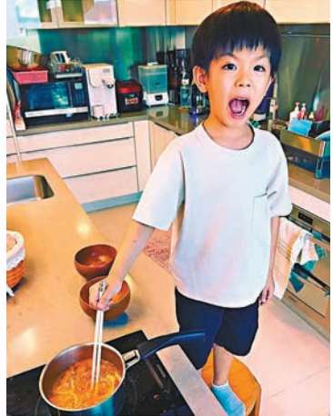
5歲的「小春雞」已識煮即食麵。