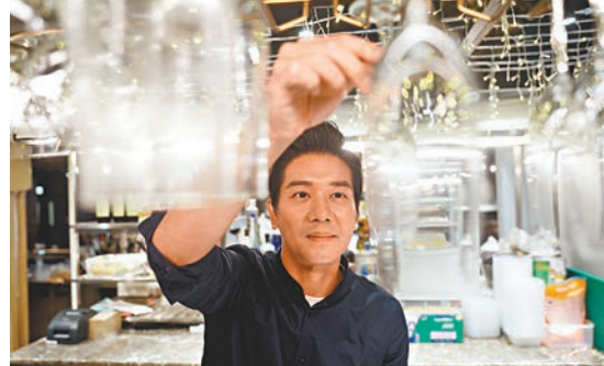
黎諾懿開餐廳的夢想暫時未能實現。