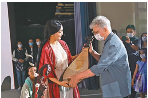
英國知名導演柯文思被演出樂器吸引。