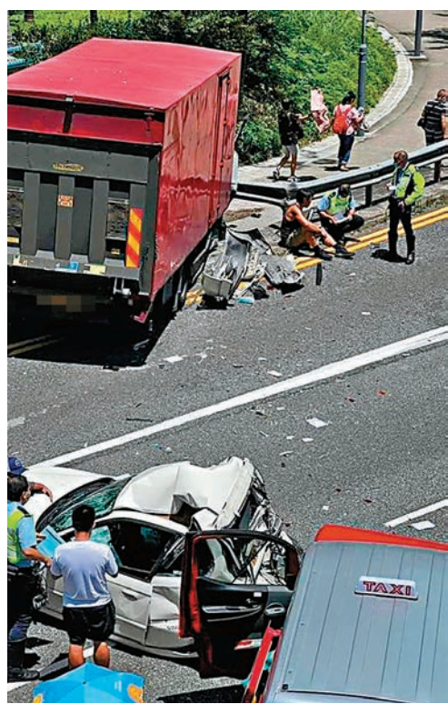
◆本田私家車車尾嚴重凹陷。

香港文匯報訊（記者 蕭景源）黃大仙龍翔道昨日發生5車連環相撞驚險車禍。一輛向觀塘方向行駛的中型貨車，在龍蟠苑對開遇大塞車，疑收掣不及，狂越前面一輛本田私家車，再如打保齡般彈撞前面兩輛私家車及一輛的士，貨車則失控掃毀防撞欄剷上行人路。本田房車車尾被撞至凹入車廂，車身幾乎縮短一半，幸當時後座未有乘客。車禍共6人輕傷，更再度釀成塞車，車龍一度長達5公里。