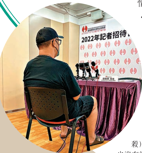
◆阿樂憶及母親5年前在家中上吊身亡，坦言當下「想跟媽媽走。」