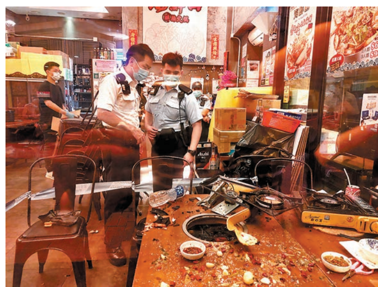
◆火鍋店發生卡式石油氣爐爆炸傷人意外後，現場一片狼藉。警員到場進行調查。

示，事後派員到場經調查，懷疑有人不當使用卡式石油氣爐，在煮食時兩台卡式石油氣爐平排使用，並在爐面放置過大的煮食器皿，導致氣體罐疑過熱而發生爆炸意外。署方會繼續跟進該意外調查工作。