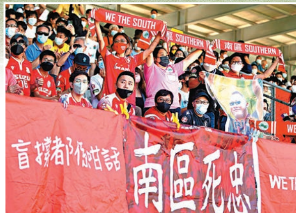
南區「死忠」落力為己隊打氣。

經歷了長達7個多月的真空期後，「2022至23年度中銀人壽香港超級聯賽」昨日在酷熱天氣下開鑼，一眾本地球迷餓波已久，全日吸引到3,312人次入場，看台上打氣聲此起彼落，象徵着本地波終於重回正軌。不過，首日4支亮相球隊都明顯患上「季初病」，表現並未在最佳水平。冠忠南區在揭幕戰小試牛刀，以2：0輕取香港U23；明天出發亞協盃的東方龍獅，則與重返港超的和富大埔踢成0：0，未能以勝仗一壯行色。