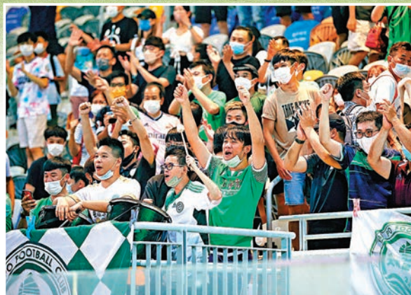
今季港超揭幕日共吸引3,312人次入場。

經歷了長達7個多月的真空期後，「2022至23年度中銀人壽香港超級聯賽」昨日在酷熱天氣下開鑼，一眾本地球迷餓波已久，全日吸引到3,312人次入場，看台上打氣聲此起彼落，象徵着本地波終於重回正軌。不過，首日4支亮相球隊都明顯患上「季初病」，表現並未在最佳水平。冠忠南區在揭幕戰小試牛刀，以2：0輕取香港U23；明天出發亞協盃的東方龍獅，則與重返港超的和富大埔踢成0：0，未能以勝仗一壯行色。