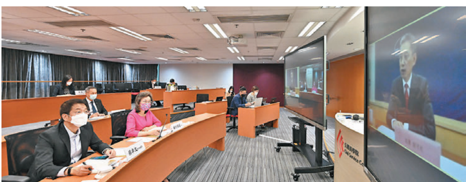
◆公務員學院與外交部駐港特派員公署舉辦的第八場「國家外交事務系列」講座於昨日舉行。

國家主席習近平在慶祝香港回歸祖國25周年大會暨香港特別行政區第六屆政府就職典禮中發表的重要講話中，充分肯定了香港在「一國兩制」下與世界各地緊密聯繫的獨特優勢。因此，特區公務員應該更深入地了解國家的外交政策，從而擴闊他們的國際視野，充分發揮香港作為世界金融、貿易、航海中心的地位優勢。