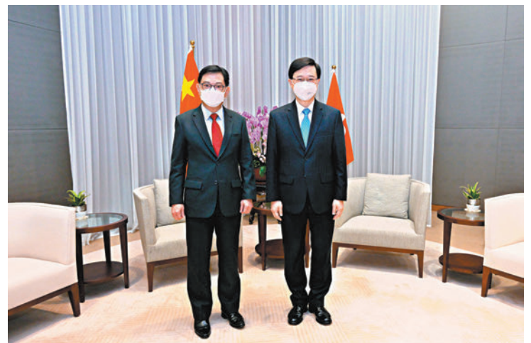
◆李家超昨日與新加坡副總理兼經濟政策統籌部長王瑞杰(左)會面。

於8月31日舉行的第七屆「一帶一路高峰論壇」。他表示，香港與新加坡長期保持密切關係，雙邊貿易近年持續增長，新加坡更是香港第四大貿易夥伴。在疫情下，2021年兩地的雙邊貿易仍然較2020年上升了接近30%，總額超過4,830億元。