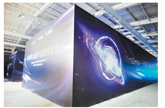
◆服貿會首次設置元宇宙體驗專區，為公眾帶來沉浸式新體驗。

此外，設在首鋼園的數字人民幣展區今年精彩繼續。消費者可以在展區體驗用數字人民幣購物的完整流程，以及數字人民幣在供應鏈金融、物流和社會公益等創新化場景的應用。觀眾還能在