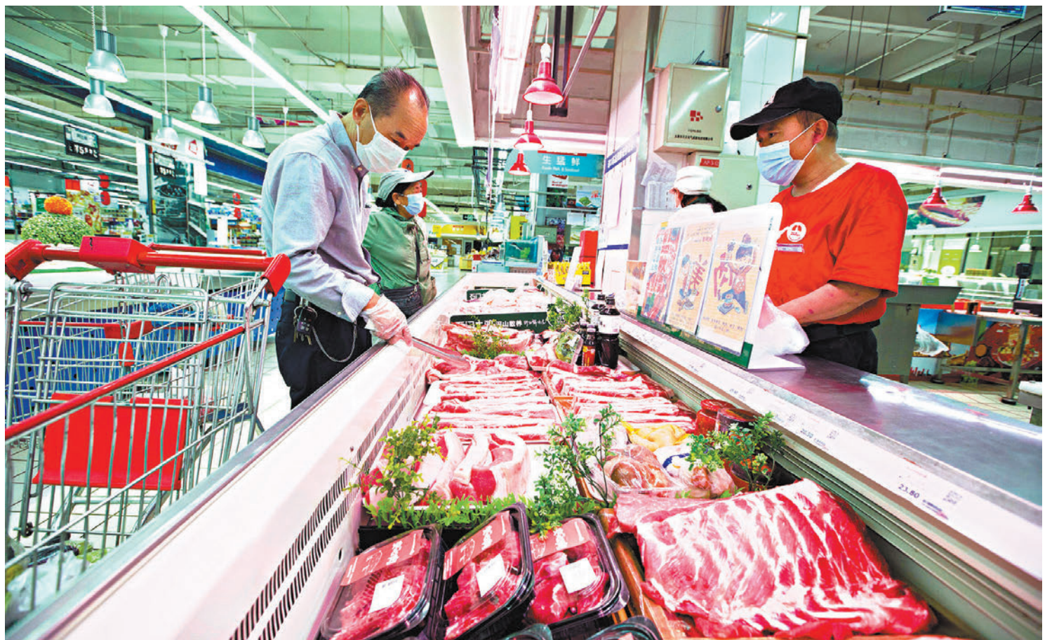
◆國家發改委8月29日發布消息，自9月份開始分批次投放政府豬肉儲備。圖為山西太原，消費者在超市選購豬肉。

農業農村部近日也部署穩定豬價工作，表示將緊盯能繁母豬存欄量等關鍵指標，適時採取針對性調節措施，保持生豬產能穩定在合理區間。同時壓實屬地責任，督促地方落實生豬穩產保供省負總責要求和「菜籃子」市長負責制，穩定並落實長效性支持政策，給行業一個穩定的政策預期。另外，要求防好生豬疫病，確保疫情形勢平穩不反彈。