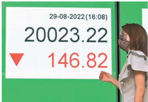
◆ 港股昨一度挫280點，收市跌幅收窄，兩萬點大關失而復得。

今年環球經濟反覆不定，加上疫情持續、中美博弈、地緣政治風險升溫等因素，令港股蒙上陰霾，投資者入市審慎。不過耀才證券(1428)昨公布的「第四季及明年經濟大市前瞻」調查顯示，高達55%受訪散戶認為恒指今年底可望升穿