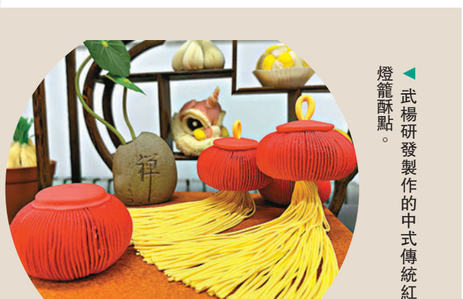
武楊研製製作的中式傳統紅燈籠酥點。