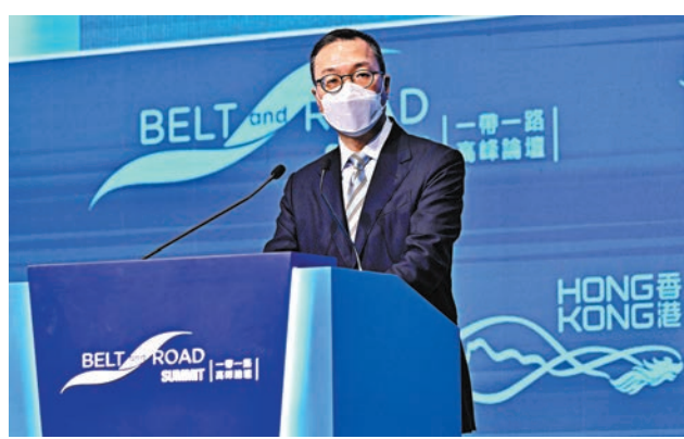
◆林定國表示，現正是通過「一帶一路」國際合作平台，探索新機遇和不同合作的好時機。

他續指，香港法律雲端服務為法律和解服務提供安全、快速和負擔得起的文件和信息訪問存儲。2020年4月，香港加入亞太經合組織(APEC)合作框架，為跨境企業對企業糾紛提供網上服務，鼓勵中小微企和媒體利用在線談