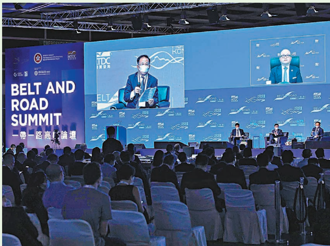
圖為第七屆「一帶一路」高峰論壇政策對話環節現場。

在昨日第七屆「一帶一路」高峰論壇的政策對話環節，東盟國家包括新加坡、印尼、馬來西亞和泰國等國的主要官員共同探討了在「一帶一路」、《區域全面經濟夥伴關係協定》(RCEP)下，區內經濟如何加強政策配合，共同應對目前日趨複雜的地緣局勢，在疫情後重拾經濟增長步伐，實現互利共贏。他們指出，東盟國家希望吸引更多國際投資者，香港是國際金融中心，亦是與內地對接的重要平台，相信可以在多方面作出貢獻。 ◆香港文匯報記者 周曉菁