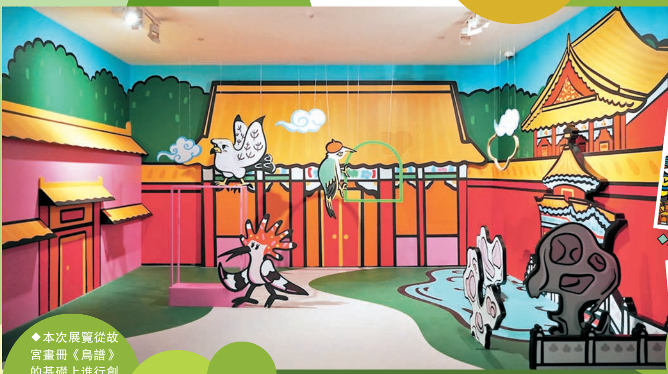
◆本次展覽從故宮畫冊《鳥譜》的基礎上進行創作，成為可愛的插畫風格。

走進該場景，頭上是大量藍色水喜鵲剪影，周圍是紅樹林、海礁和浪花，深圳的海洋生態呼之欲出；再往後，則沿着錯落有致的荷葉進入了長江三角洲，蛋殼狀的大型鳥巢映入眼簾，令人聯想到極具地域特點的濕地灘塗、河流、蘆葦沼澤；第三站，顯眼的鳥中鳳凰紅腹錦雞，明艷熱烈的特有花卉，都在告訴參展者已經來到了秦嶺地區的高山濕地；最後，在窗花、建築、中式紋樣、層層祥雲之中，回到北京故宮所在的皇家園林……這一場觀眾親身跟隨、經歷的沉浸式「遷徙之旅」，不僅順應了大眾認知，以清晰明瞭的方式進行科普，向觀眾介紹了中國鳥類的分布情況；另一方面，模塊化的內容設計，也讓展覽適配了不同巡展地的受眾，拉近與各地觀眾的距離，讓參觀者更有參與感。